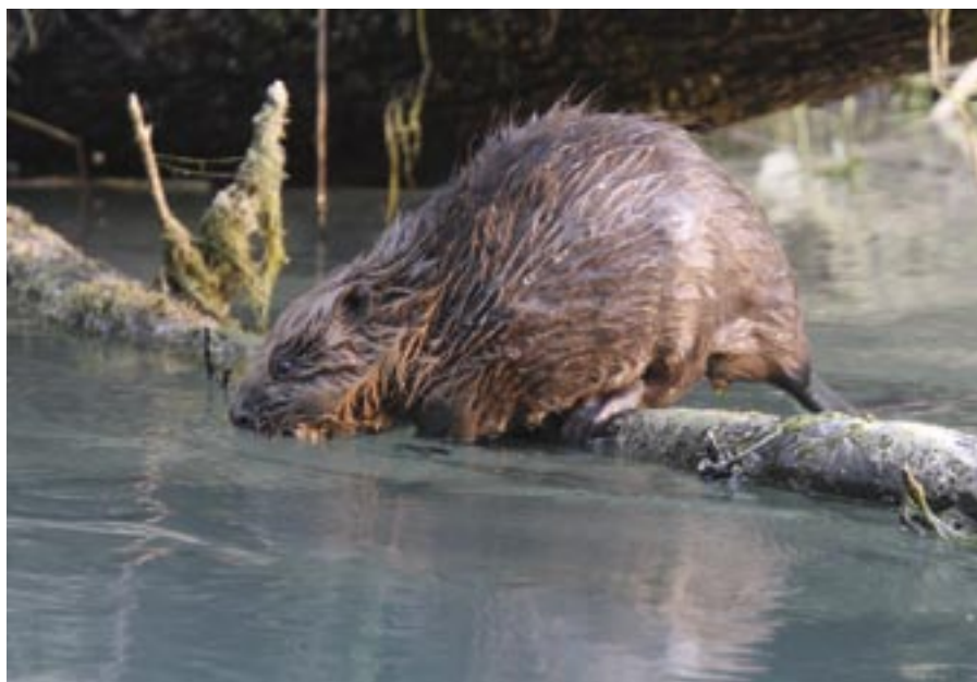
Le castor a fréquenté le canal et les étangs au printemps.

Les fluctuations sont habituelles chez ce petit batracien. L'avenir nous dira si l'augmentation des grenouilles rieu-ses et l'apparition de poissons dans les étangs influencera négativement la population de rainettes.