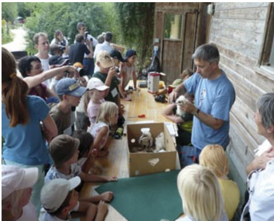
Les jeunes effraies des clochers sont baguées devant un nombreux public.

Des excursions et démonstrations de baguage ont été suivies par le public et les représentants des médias.