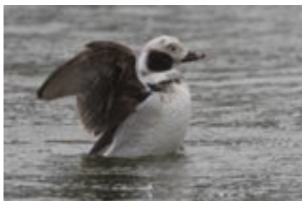
Nouvelle espèce: une harelde boréale

2 hérons garde-boeufs ont stationné le 4 mai, 1 héron crabier a fréquenté