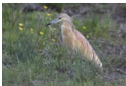
Un héron crabier a séjourné en mai.

Parmi les anatidés, citons quelques rassemblements intéressants: 62 fuligules milouins le 11 mars, 76 oies cendrées le 30 juin et 71 sarcelles d'hiver le 14 septembre.