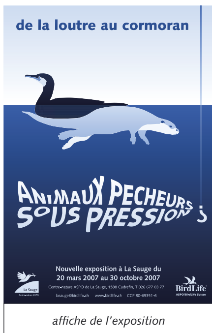
affiche de l'exposition