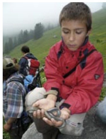
découverte des serpents dans les Préalpes fribourgeoises

Le centre a participé aux journées internationales des migrations qui se tiennent traditionnellement en