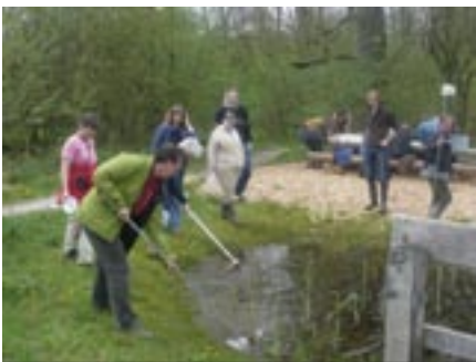
cours de formation sur la qualité biologique des étangs

L'ASPO a accueilli à La Sauge les groupes et institutions suivantes: -Association mondiale des zoos et aquariums WAZA, Ecole d'Ingénieurs de Lullier EIL, la Haute Ecole Pédagogique BEJUNE, les étudiants de la HEP BEJUNE, Bio Fribourg, diverses sections de l'ASPO, les collaborateurs de la Station d'épuration de Berne, les étudiants de la formation en écologie ECOFOC, l'association du musée d'histoire naturelle de Berne, le conseil de la fondation J.P. Schnorf, divers Passeports-Vacances.