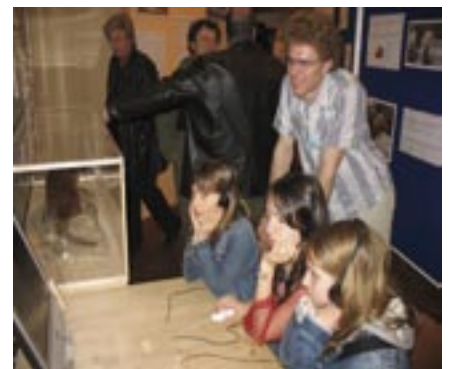
L'exposition a été visitée par un public varié.