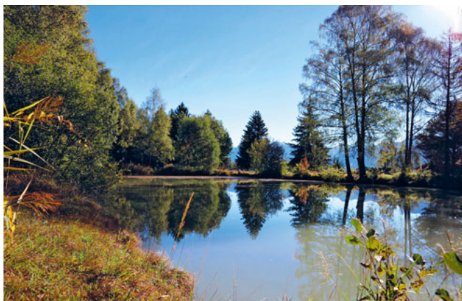
La section BirdLife « Le Rougegorge » a conduit avec la commune un projet de revitalisation de l'étang de la tourbière d'Arbaz (VS).

Ce projet de jubilé, dont l'objectif était de créer 100 habitats de grande valeur écologique, a rencontré un énorme écho dans les sections et les associations cantonales. A ce jour, environ 150 projets ont déjà été réalisés ou sont en cours de planification. Une première évaluation, qui porte sur environ la moitié des projets, donne des chiffres étonnants : plus de 350 arbres à haute tige et près de 3000 buissons ont été plantés. 14 murs de pierres sèches ont été réalisés. Plus de 44'000 m 2 de prairie fleurie, 300 m 2 de prairie sèche et 150'000 m 2 de jachère florale ont été aménagés. 29 plans d'eau ont déjà été creusés et 21 sont en cours de planification. La finalisation de nombreux joyaux naturels BirdLife est prévue pour 2023.