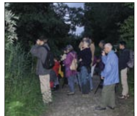
La sortie «Sur les traces du castor» a connu un grand succès. Tous les participants ont pu observer cet animal farouche et discret.