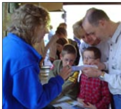
Stand de l'ASPO/BirdLife Suisse au Festival Salamandre 04. Cette manifestation a permis de rencontrer un public nombreux et motivé par la protection de la nature.