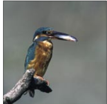
Le martin-pêcheur se laisse observer de près au petit étang.

Le petit étang reste le lieu privilégié pour observer le martin-pêcheur. L'équipe du centre a pu consigner et filmer de nombreux comportements intéressants manifestés par ce magnifique oiseau. Ce film sera visible dans le cadre de la nouvelle exposition dès le printemps 2005. Il a pu être démontré que des changements entre les partenaires interviennent entre les trois nidifications constatées en 2004. Des escarmouches se produisent régulièrement entre le couple installé et des prétendants. 7 jeunes ont pris leur envol avec un échec probable de la seconde nidification. La falaise destinée aux hirondelles de rivage n'a malheu-