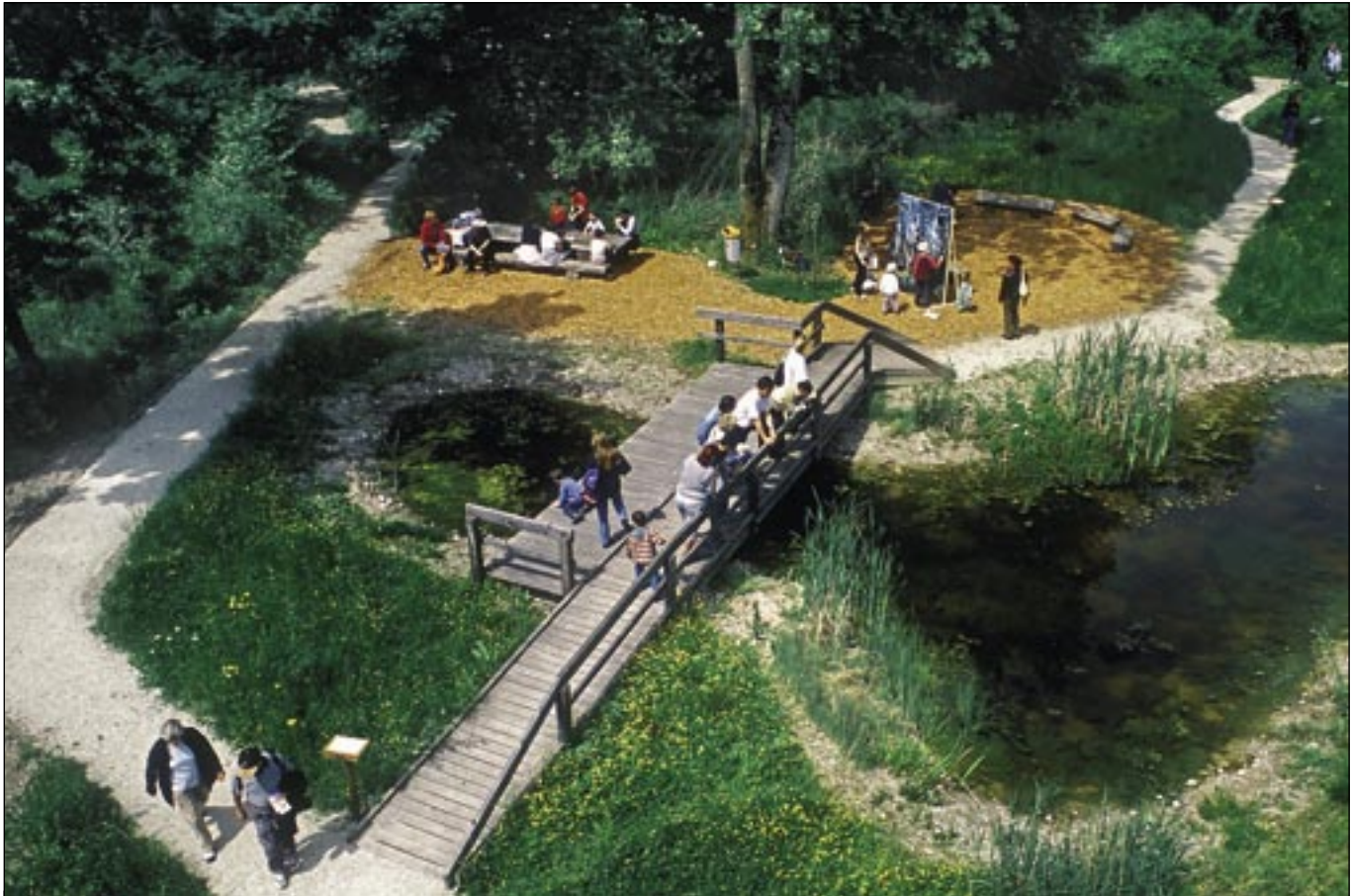
Journée portes ouvertes du centre-nature le 16 mai 2004. Près de 650 personnes ont profité des diverses animations mises en place par l'équipe du centre.