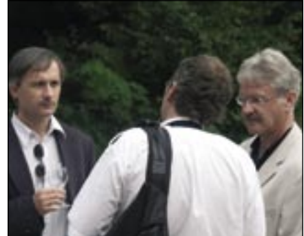
Le Conseiller d'Etat Beat Vonlanthen (à dr.), lors des 25 ans du WWF Fribourg à La Sauge.

d'information de la Grande Cariçaie, qui cherche à développer des projets de tourisme durable sur la rive sud du lac de Neuchâtel;