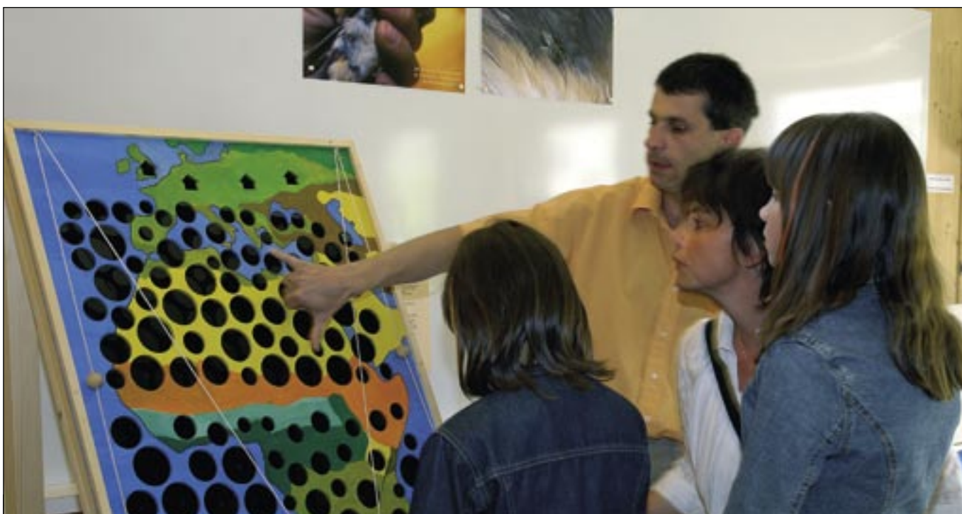
Le nouveau jeu de l'exposition «Hirondelles & martinets» a rencontré un vif succès auprès des petits et des grands.

Le siège romand de l'ASPO/BirdLife Suisse a pris place dans un nouveau local transformé en bureau dans l'hôtel de La Sauge. Les tâches d'information du public, en particulier avec la collaboration des médias, constituent la principale activité menée par l'antenne romande.