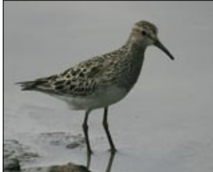
Le rare bécasseau tacheté observé à La Sauge.