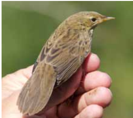
Locustelle tachetée fraîchement baguée.

Plusieurs espèces d'oiseaux d'eau ont fréquenté les étangs durant la période des migrations. Par rapport à l'an passé, les sarcelles d'hiver ont été moins nombreuses, surtout en mars-avril. Seules, trois observations printanières (avril) et deux observations estivales (août-septembre) ont été enregistrées chez la sarcelle d'été . Par contre, un