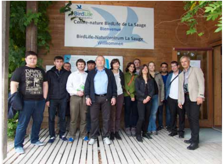
Délégation des ministres de l'environnement des Républiques d'Asie centrale.