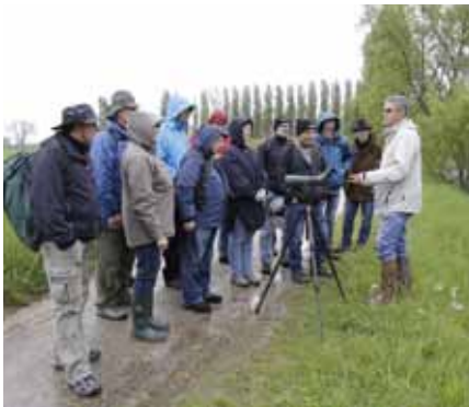
Public attentif le long du canal de la Broye.