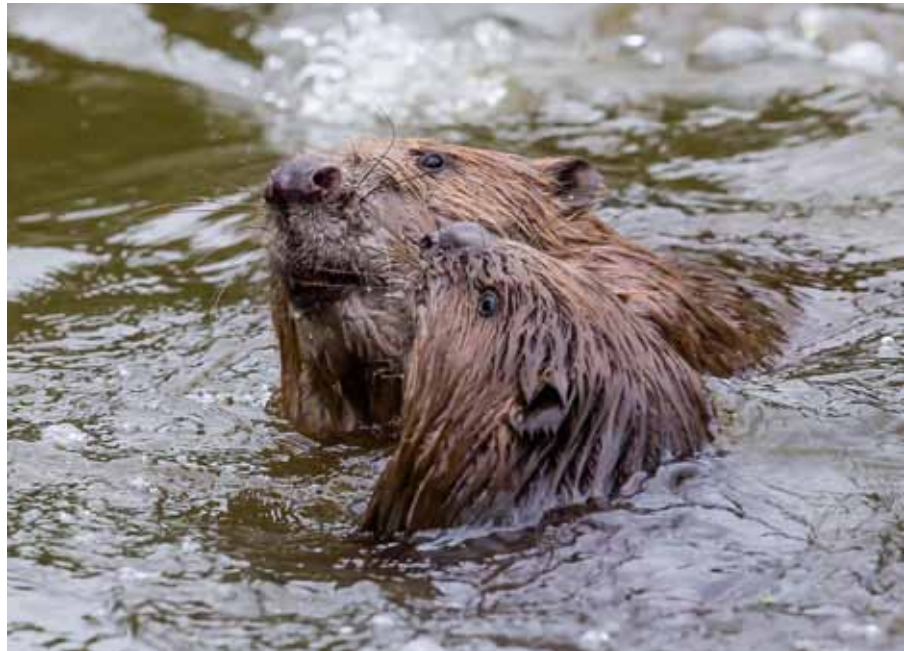
Observation matinale de deux castors dans le petit étang.

A partir de mi-juillet, le castor a fréquenté le petit étang. Actif surtout de nuit, les deux individus se sont fait remarquer par leurs indices de présence: restes de nourriture, sentiers et amas de branches et de plantes. Certains