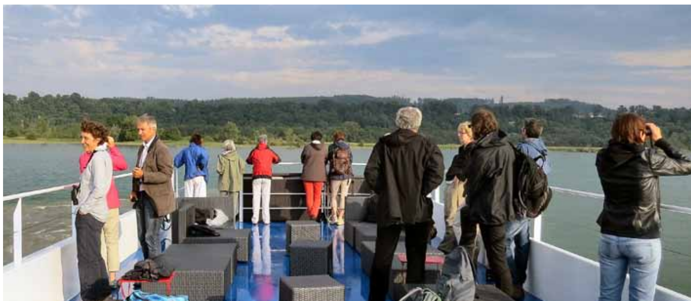
Découverte de la Grande Cariçaie à bord du «Romandie».