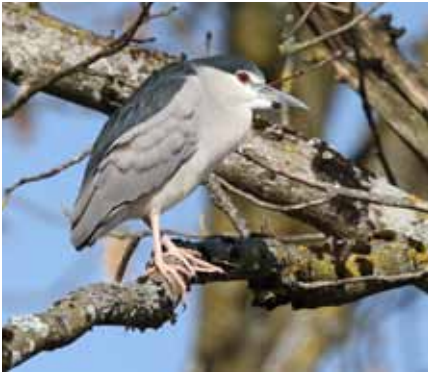
Un bihoreau gris se réchauffe sous les rayons du soleil printanier.