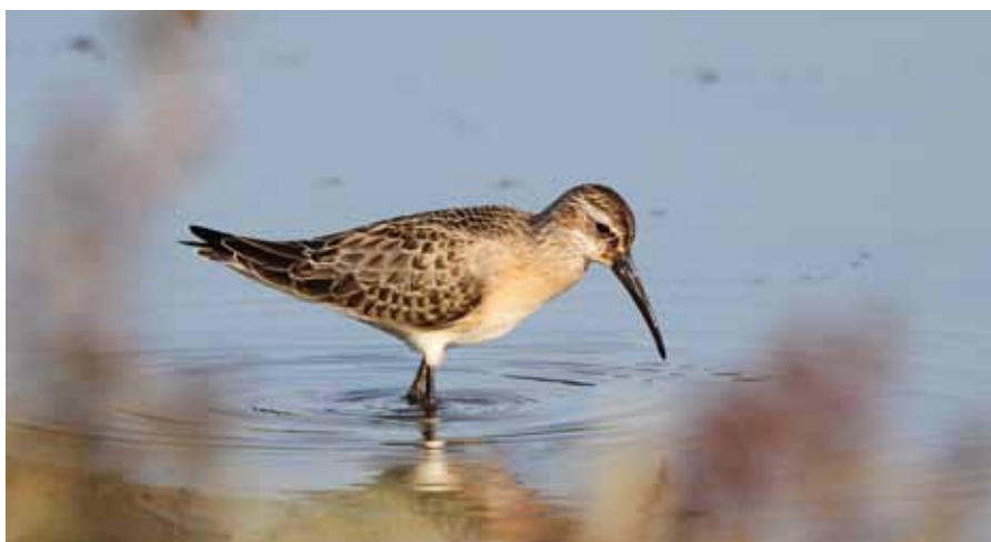
Un bécasseau cocorli en chasse au grand étang.

Chez les passereaux, la présence de 11 réimiz pendulines le 27 mars a été remarquée comme plusieurs observations estivales de fauvettes grisettes et fauvettes babillardes dans les haies bordant le sentier-nature. Les rossignols ont été discrets et peu nombreux cette année avec 3 territoires