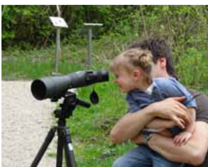
Elle est où la grenouille ?