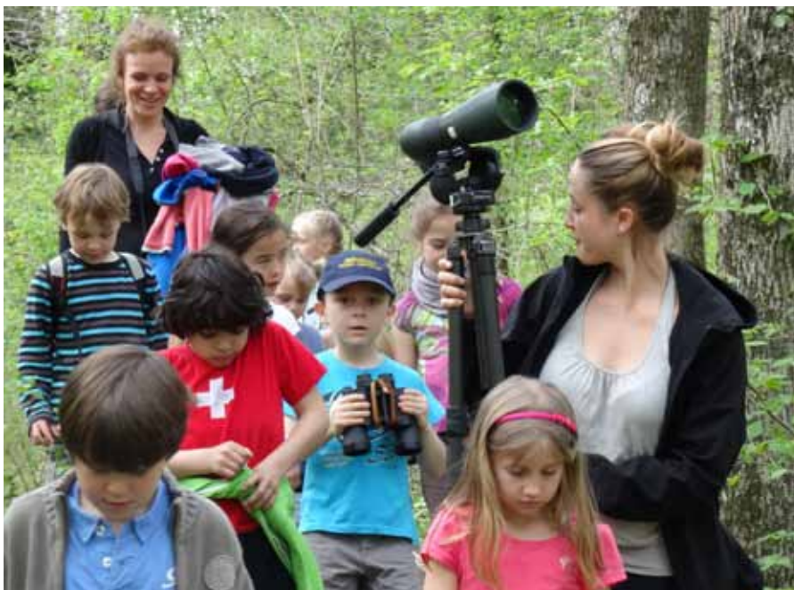
Enfants à la découverte le long du sentier nature.

165 groupes dont 63 classes ont réservé une animation parmi l'offre variée disponible. 73 groupes ont choisi la visite du centre d'une durée de une heure. Les modules d'animation qui ont connu le plus de succès auprès des écoles ont été «la petite faune de l'étang» et «Les animaux de La Sauge».