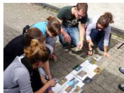
Stagiaires en formation.