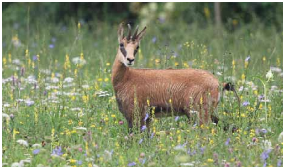
Jeune chamois en visite sur la prairie fleurie du grand étang.