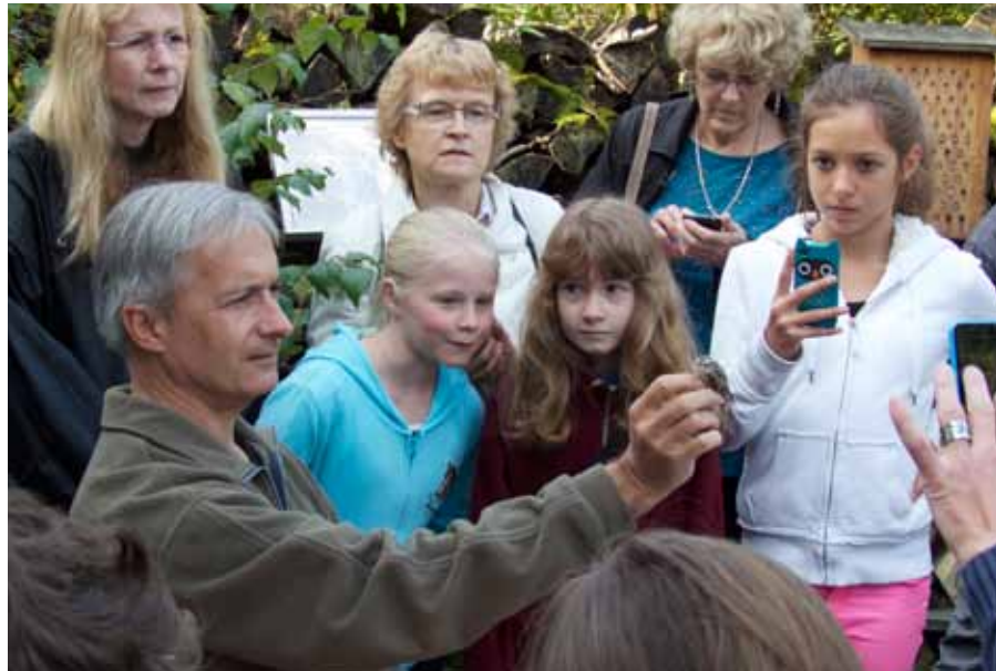
Vivre des moments privilégiés avec les oiseaux au centre-nature BirdLife de La Sauge.

Un résumé du rapport des finances peut être obtenu sur demande. La contribution de l'OEFV et du canton de Vaud est importante pour assurer le fonctionnement du centre, de même que les dons des quelque 400 donateurs. L'ASPO continue de contribuer pour près de 100'000.- de fonds propres au projet.