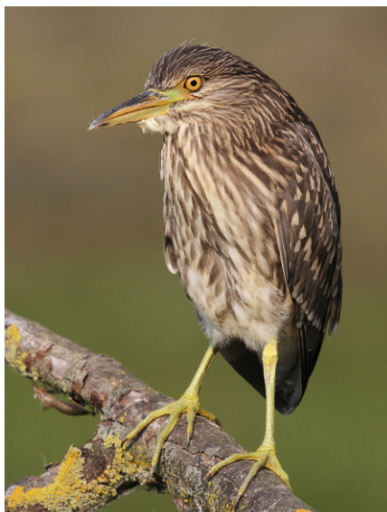
Jeune bihoreau gris

Parmi les 14 espèces de limicoles observées à La Sauge, mentionnons 2 échasses blanches le 8 juin et 1 le 5 juillet. En automne, des bécasseaux cocorlis (max. 5 le 31.8), variables (max. 18 le 15.10) et minute (1 du 14 au 17.10) ont stationné ce qui est peu coutumier. Les courlis cendrés sont toujours réguliers sur le domaine: des