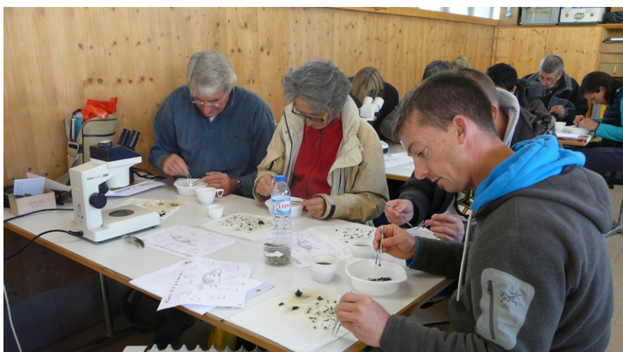
Les participants de la formation romande en ornithologie découvrent les indices de présence des oiseaux à La Sauge.

Vaud, ainsi que nos donateurs. Notre gratitude va aussi à la Fondation J.P. Schnorf, propriétaire, ainsi qu'au personnel de l'Auberge de La Sauge, de même qu'au domaine du Chat Noir à Mur, nos partenaires directs, ainsi qu'à la commune de Cudrefin.