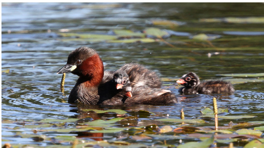
Le grèbe castagneux a de nouveau niché avec succès.