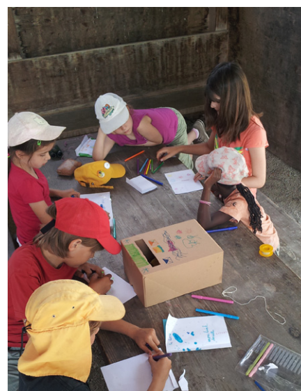
Module de découverte des animaux adapté aux jeunes enfants.