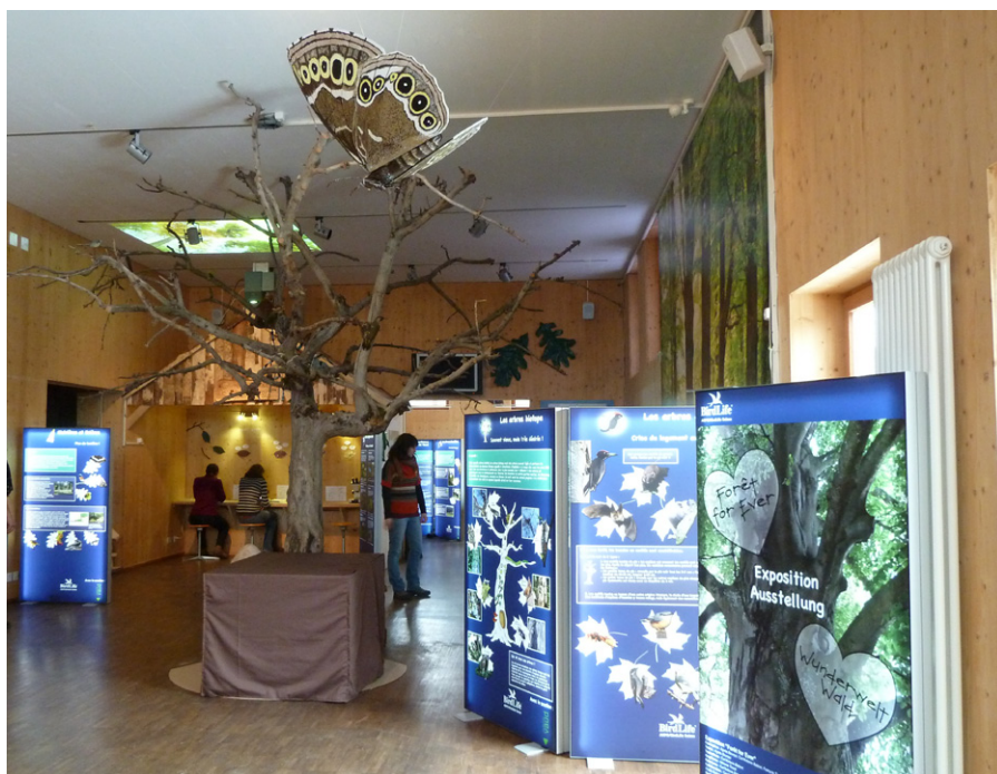
La nouvelle exposition consacrée à la biodiversité en forêt.

choisi la visite du centre; les modules animaux pour les enfants de moins de 5-7 ans et celui sur la faune de l'étang ont rencontré également un beau succès.