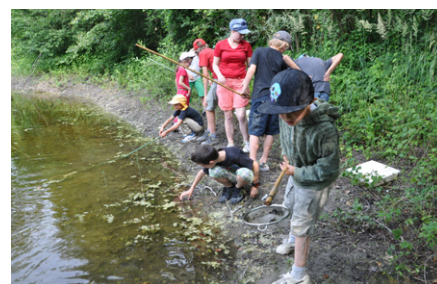
Le camp non résidentiel a été très apprécié des enfants.

Les traditionnels camps offrent de belles opportunités de sensibiliser les