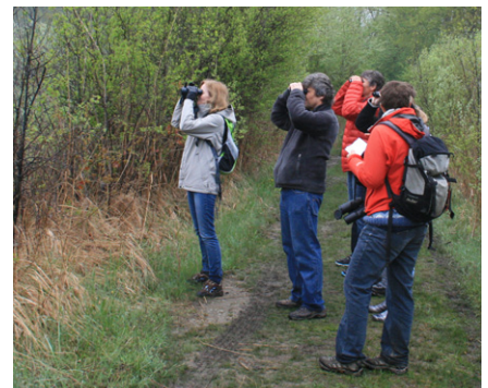
A la découverte des pics de nos forêts.

Malgré le mauvais temps printanier, 12'350 personnes ont visité le centre-nature ASPO de La Sauge en 2013, un chiffre comparable à l'année précédente. Les visiteurs des cantons de Berne, de Vaud et de Neuchâtel représentent près de deux-tiers des entrées. 162 groupes dont 67 écoles différentes ont réservé un module d'animation cette année. 52 groupes ont