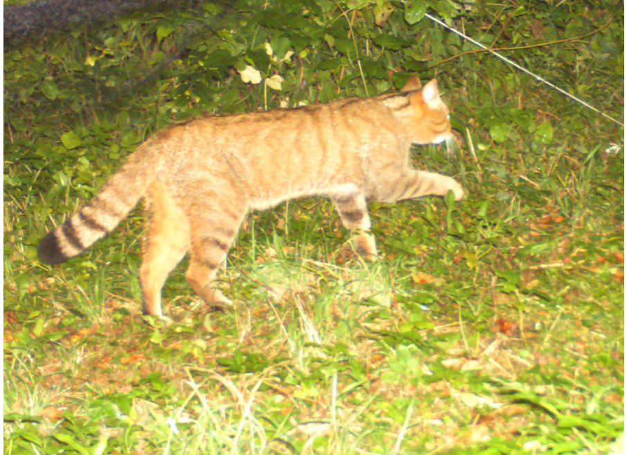
Un chat forestier immortalisé par l'un des pièges-photo. Seule une analyse ADN permet toutefois d'exclure un chat domestique.

D'autres dispositifs ingénieux comme des pièges-photos permettent de surprendre les mammifères. Cette année, les espèces suivantes ont été recensées: renard, fouine, martre, blaireau, lièvre, sanglier et chevreuil ont été immortalisés. Un chat sauvage a fréquenté régulièrement la lisière de la