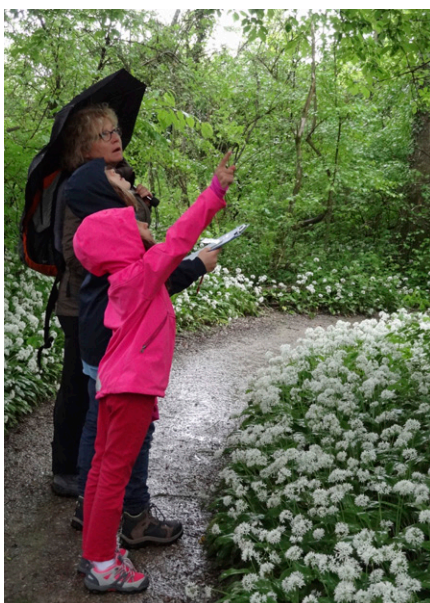
Au printemps, découverte de la forêt et du parterre d'ail des ours.