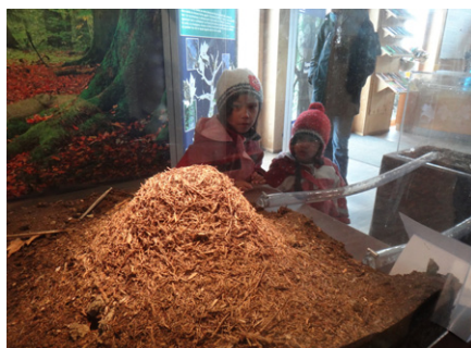
La fourmilière des bois a fasciné le public.

Une évaluation du travail d'éducation à la nature sous la forme d'un questionnaire a été menée auprès de nos groupes en animation cette année. Il ressort de cette enquête que nos visiteurs sont très satisfaits des prestations, tant du point de vue du contenu des animations que de l'organisation