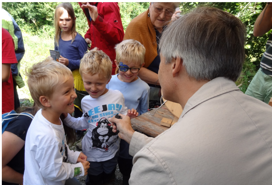
Dans ses centres-nature, l'ASPO privilègue le contact direct avec la nature.

Merci en particulier aux institutions qui ont soutenu nos travaux et projets en 2013 : Fondation Ernst Göhner, Loterie romande, Société coopérative Migros Neuchâtel-Fribourg, Fondation Karl Mayer, fondation Nature & Découvertes, l'Office Fédéral de l'Environnement OFEV et du canton de Vaud, Direction générale du canton de