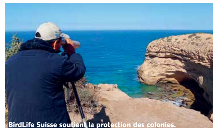
BirdLife Suisse soutient la protection des colonies.