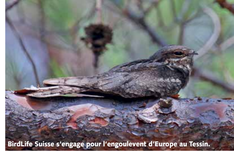
BirdLife Suisse s'engage pour l'engoulevent d'Europe au Tessin.

semées sont créées, correspondant aux besoins de ce rare oiseau nocturne. Chez le râle des genêts , qui ne survit comme oiseau nicheur en Suisse que grâce au programme de BirdLife, l'effectif a été un peu plus élevé que l'année passée. Pour le tarier des prés , nous testons de nouvelles méthodes avec une grande offre en perchoirs. BirdLife Suisse, Pro Natura et le WWF ont dû consacrer beaucoup de temps pour accompagner la révision de la Loi sur la chasse et la protection (LCHP) . Les auteurs de la révision souhaitent que davantage d'animaux protégés puissent être tirés même quand aucun dégât n'est constaté. Nous nous engageons pour empêcher cela.