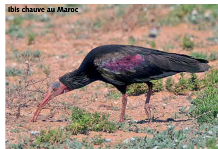
Ibis chauve au Maroc

que les colonies du Proche-Orient se sont éteintes. Le projet de protection du partenaire BirdLife marocain GREPOM comprend la surveillance des deux colonies de reproduction restantes le long de la côte. L'ibis chauve est très sensible aux dérangements près de ses nids. Il s'agit en outre de sécuriser ses sites de nourrissage et de protéger immédiatement les nouvelles colonies. En l'espace de vingt ans, le programme de protection a conduit à un doublement des effectifs qui atteignent actuellement 120 couples. BirdLife Suisse aide à assurer ce succès et à étendre le projet.