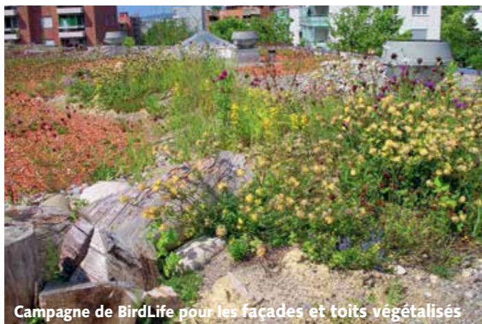
Campagne de BirdLife pour les façades et toits végétalisés

En collaboration avec des juristes, BirdLife a étudié en détail les dispositions de protection : les nids des oiseaux nichant sur les bâtiments ne peuvent pas être enlevés sans autre, même en hiver. Le dérangement de la reproduction dès l'occupation des sites de nidification est exclu. BirdLife Suisse informe les communes sur ces questions.