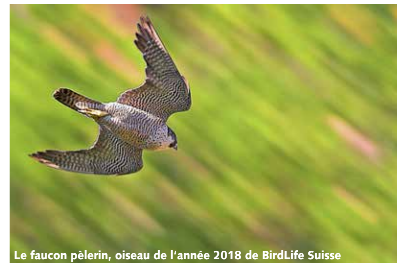
Le faucon pèlerin, oiseau de l'année 2018 de BirdLife Suisse