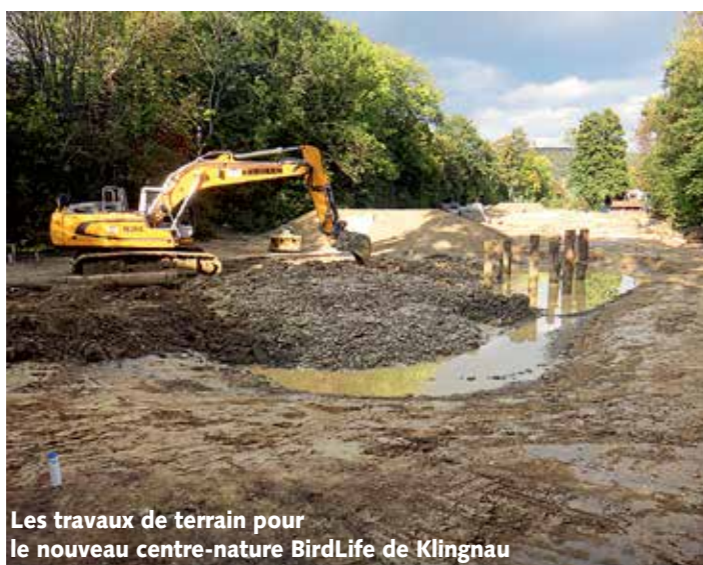
Les travaux de terrain pour le nouveau centre-nature BirdLife de Klingnau

L'action « Oiseaux de nos jardins » fait connaître à la population les oiseaux qui vivent près de chez nous. Lors des journées internationales des oiseaux migrateurs en automne, plusieurs milliers de personnes sont informées chaque année sur la migration des oiseaux. Six ans après avoir débuté en Suisse romande, la Fête de la nature a été organisée par BirdLife en Suisse alémanique et au Tessin . Prochainement, la limite des