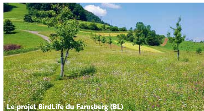
Le projet BirdLife du Farnsberg (BL)

tation, contrairement à la tendance nationale, grâce à de nombreux nouveaux arbres fruitiers à haute tige et des structures. En se basant sur de telles expériences, BirdLife Suisse exerce une influence sur la politique agricole , actuellement la PA22+.