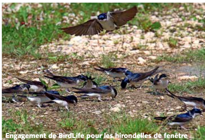
Engagement de BirdLife pour les hirondelles de fenêtre