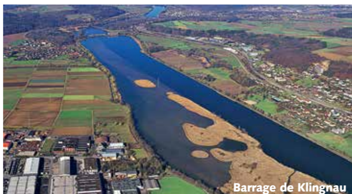
Barrage de Klingnau

obtenu la renaturation de grandes surfaces . Cette pratique est en vigueur depuis des décennies. Nous combattons la suppression de cette obligation de réaliser des mesures de compensation. Cela rendrait de nombreux projets de protection de la nature impossible.