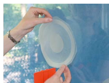
Placez le motif sur la vitre