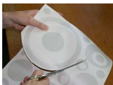
Découpez le motif