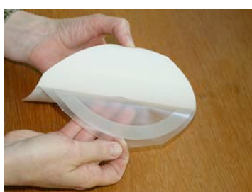
Retirez le papier support