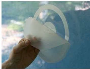
Retirez la feuille de transfert