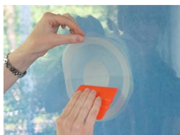
Appuyez sur le motif