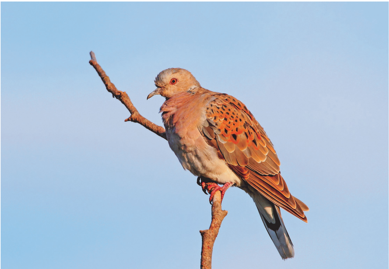
Abb. 5: Insbesondere für die stark rückläufige und bestandsgefährdete Turteltaube Streptopelia turtur ist die Bejagung im Mittelmeerraum ein erheblicher Gefährdungsfaktor

Ratifizierte Vereinbarungen sind umzusetzen, und sollten sich Vereinbarungen für die Erreichung des Ziels als zu vage formuliert erweisen, sind sie zu überarbeiten. Absichtserklärungen allein helfen nicht weiter, und wenn Mahnschreiben wirkungslos verpuffen, müssen drakonischere Maßnahmen folgen. Dass dabei auch psychologisches Geschick, intime Kenntnis der regionalen Befindlichkeiten und Erklärungen, warum die Fortsetzung massenweiser Nachstellungen für viele Zeitgenossen unerträglich wird, gefragt sind (s. VERÍSSIMO & CAMPBELL 2015), muss vor allem die Wissenschaft erkennen, die mit sachlicher Beurteilung und Aufklärung die Nationalen BirdLife Partner unterstützen müsste. Im Sinne des Wissens vor der eigenen Haustür ist in einem ersten entscheidenden Schritt – auch mit dem nötigen Engagement der Wissenschaft (!) – endlich die illegale Jagd in Europa, insbesondere in Südwest-Frankreich und in den EU-Mittelmeeranrainer-Staaten, drastisch einzuschränken.