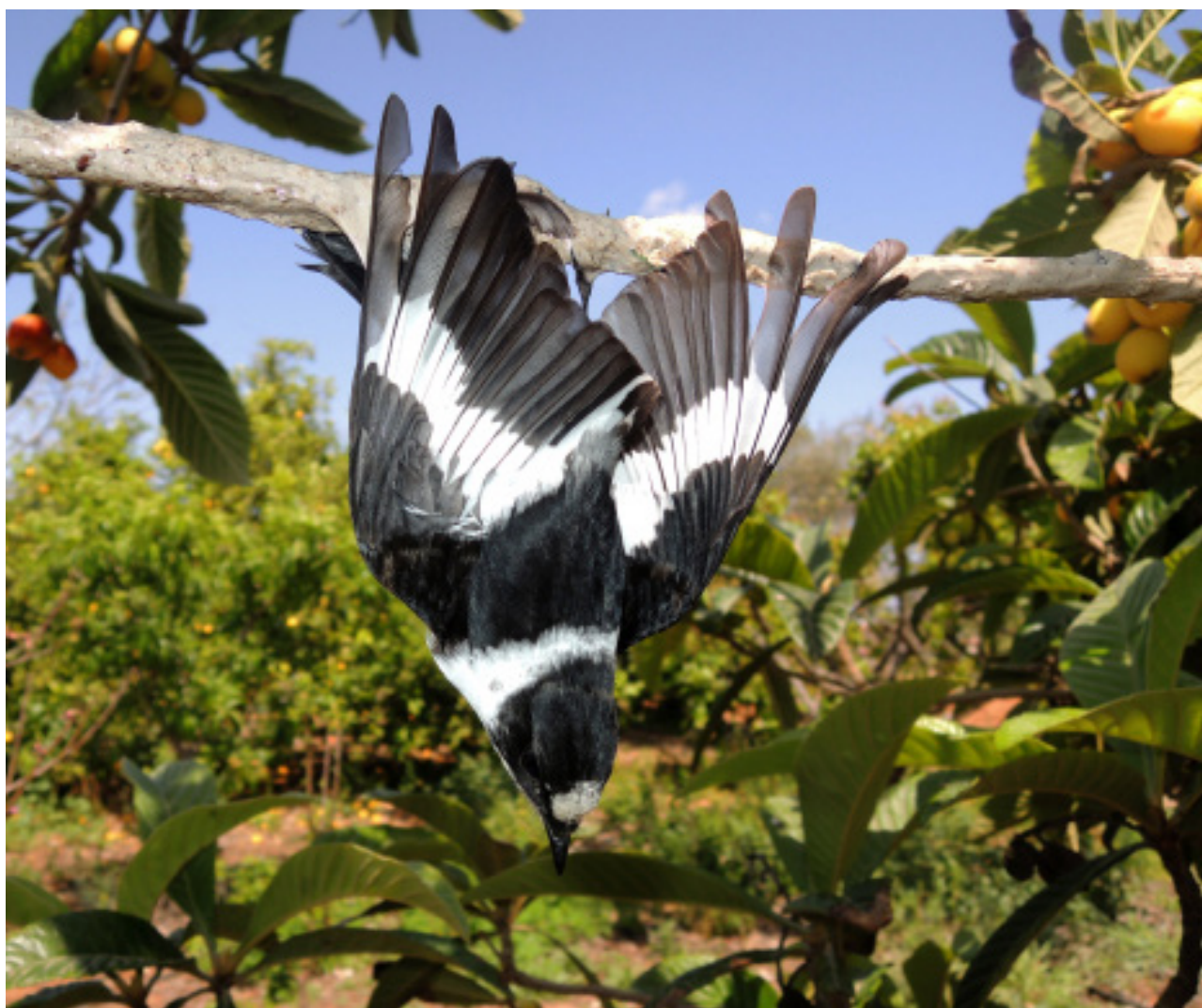
Abb. 4: An Leimrute gefangener Halsbandschnäpper Ficedula albicollis – Republik Zypern

2013 zu einem Bestandsrückgang von 84-95 % einer der am weitesten verbreiteten und häufigsten Vogelarten der Paläarktis geführt hat (KAMP et al. 2015). Hier müssten auch wir Europäer uns einbringen (s. dazu Projekt HEIM 2016). Wie lässt sich dies aber ethisch rechtfertigen, solange in der EU nicht aus Not, sondern meist zum Vergnügen oder zum lukrativen Gewinn jährlich noch weit über zehn Millionen Vögel illegal vernichtet werden?