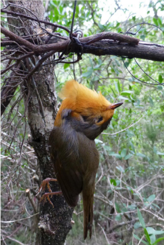
Abb. 1: In Baumschlingenfalle stranguliertes Rotkehlchen Erithacus rubecula – Sardinien

Selbst wenn wir uns um „positives Denken“ bemühen, erfüllt uns heute vieles mit Sorge. Kaum eine ornithologische Zeitschrift, die nicht über den Rückgang von Brutvogelbeständen berichtet. Die Ursachen sind so vielfältig (von Agrarmultis beherrschte, zu wenig umweltverträgliche industrielle Landwirtschaft, Erosion der Basis der Nahrungspyramide wegen steigenden Einsatzes von Herbizid-Pestizid-Cocktails, Lebensraumverlust, Degradation der Böden, zu hohe CO 2 -Emissionen, Eutrophierung, Windenergieanlagen sogar in Reservaten und Wäldern, Konsumgier, Verschwendung, Investitions-Entscheidung ohne Beachtung der möglichen ökologischen Folgen, ungenügender Schutz von Flora und Fauna von Küstengewässern und Ozeanen, Prädation u. a. m.), dass wir offenbar längst resigniert haben, auch wenn immer wieder über kleine, insgesamt aber ungenügende Fortschritte berichtet werden kann. Dies erinnert an die für 2020 festgelegten Biodiversitätsziele. Es ist schon jetzt