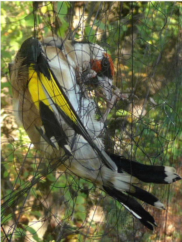
Abb. 3: In einem Fangnetz gefangener Stieglitz Carduelis carduelis – Republik Zypern

müssten zunächst genauere Kenntnisse über die populationsökologischen Auswirkungen der Jagd erworben werden, sind nicht ernst zu nehmen, da dafür notwendige Daten erst mit unrealistischem personellem und zeitlichem Aufwand beschafft werden müssten. Leider beschäftigen sich zu wenig Forschende mit gesellschaftspolitisch relevanten Themen. Dies ist sehr ärgerlich, aber auch wieder verständlich, wenn trotz recht exakter Daten dann in Gesellschaft und Politik doch zu wenig oder gar nichts unternommen wird. Ein Beispiel dafür ist die Frühjahrsjagd auf Turteltauben und Wachteln auf Malta. Obwohl der europäische Turteltaubenbestand abnimmt (2012 noch 21 % des 1980 geschätzten Bestandes), ist auf Malta seit 2010 erlaubt, im Frühjahr als Freizeitbeschäftigung (!) bis zu 11.000 Turteltauben und 5.000 Wachteln zu fangen oder zu schießen, im Herbst ist die Bejagung beider und weiterer 39 Vogelarten nicht eingeschränkt. Es darf davon ausgegangen werden, dass allein auf dieser Insel jährlich zwischen 108.000 und 264.000 Turteltauben und 8.000-11.000 Wachteln erlegt werden (ein Vergleich mit dem Brutbestand der EU-Länder insgesamt scheint mir wenig sinnvoll, da das effektive Herkunftsgebiet der Malta auf dem Weg- und auf dem Heimzug streifenden Vögel sehr viel kleiner ist). Obwohl die Voraussetzungen für eine Ausnahmeregelung im EU-Gesetz, die die Frühjahrsjagd erlaubt, nicht gegeben sind (CARUANA-GALIZIA