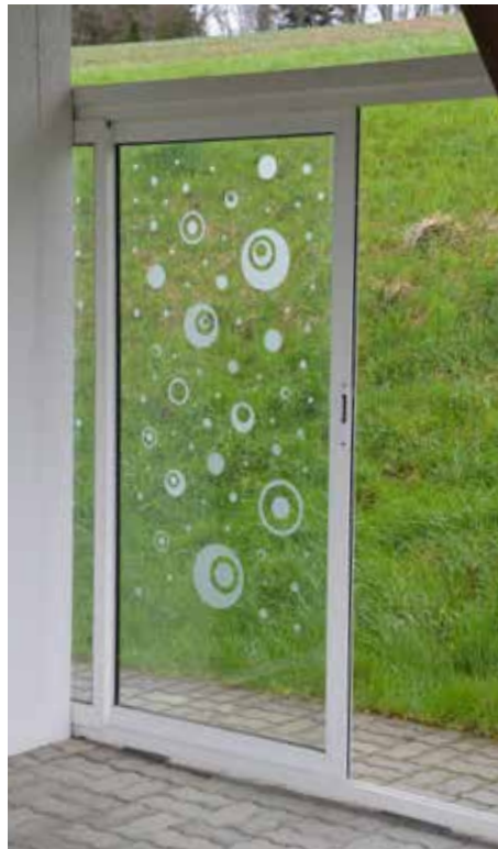
S'ils sont appliqués de façon relativement dense, les motifs à l'aspect de verre dépoli offrent une bonne protection. Ils peuvent être produits dans différentes formes.