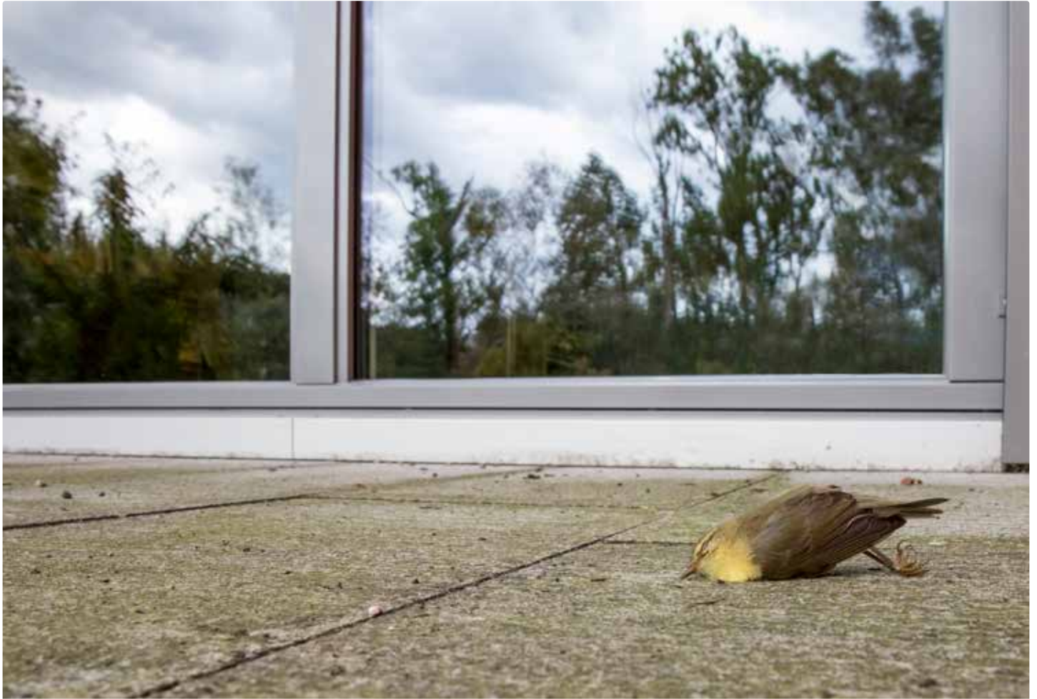
Pouillot fitis ayant heurté une vitre