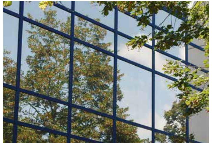
Façade réfléchissante