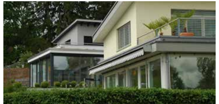
Les jardins d'hiver sont dangereux pour les oiseaux. Afin d'éviter que les oiseaux se heurtent aux vitres, il convient d'apposer des marquages sur les surfaces vitrées pour les rendre visibles. Il suffit parfois de marquer simplement les côtés et de laisser l'avant tel quel, tant qu'il ne reflète pas trop la lumière.