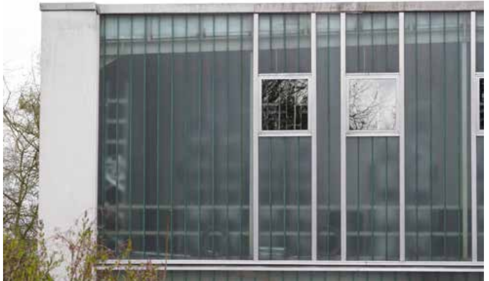
Le verre profilé laisse passer la lumière tout en offrant une protection visuelle aux personnes qui se trouvent dans le bâtiment.

En attendant de pouvoir poser des marquages, les mesures suivantes peuvent améliorer la situation :