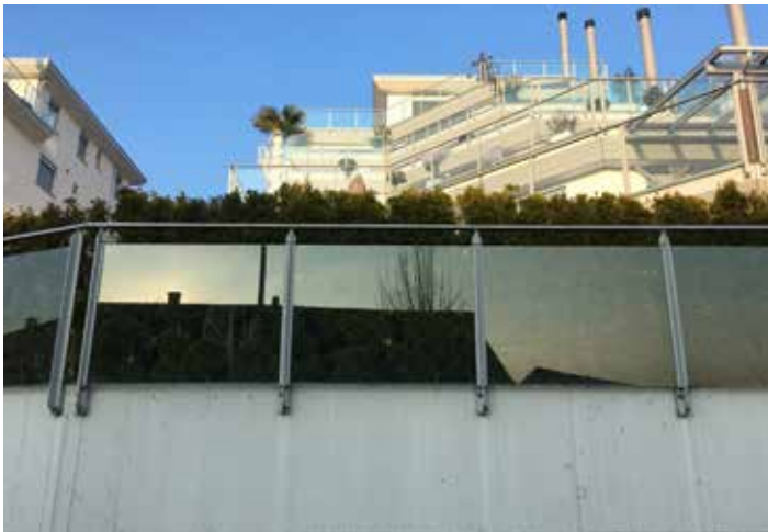
Garde-corps de balcon