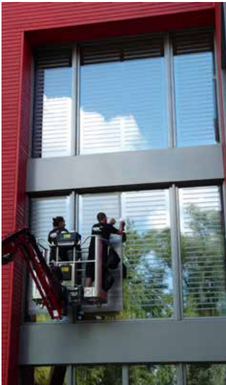
Pour un usage extérieur discret et durable: bande autocollante Oracal. Pour une application horizontale, l'espacement idéal est de 8 cm.