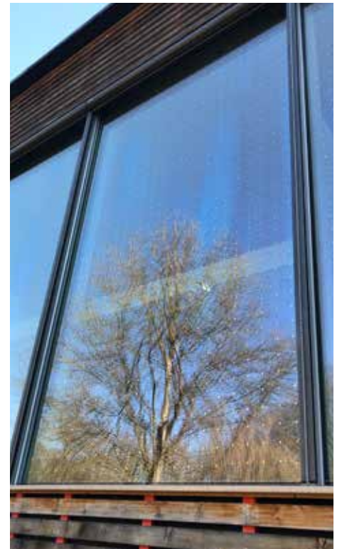
Les «SEEN-Elements» proposent une nouvelle solution. Les points ultraréfléchissants réduisent fortement le risque de collision tout en maintenant une bonne vue.