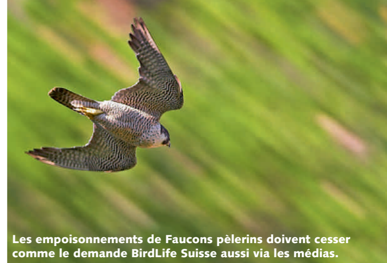
Les empoisonnements de Faucons pèlerins doivent cesser comme le demande BirdLife Suisse aussi via les médias.

roi de sable a été créée pour l'hirondelle de rivage en Argovie et immédiatement colonisée. Dans le Seeland , BirdLife Suisse a initié cette année un nouveau grand programme de conservation pour cinq espèces d'oiseaux du milieu