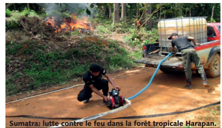
Sumatra: lutte contre le feu dans la forêt tropicale Harapan.