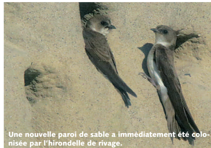
Une nouvelle paroi de sable a immédiatement été colonisée par l'hirondelle de rivage.

agricole. Un premier succès peut être fêté: Le Vanneau huppé a niché avec succès dans le Seeland pour la première fois depuis 15 ans. Les programmes pour le Râle des genêts, la Chevêche d'Athéna, la Huppe fasciée, le Martin-pêcheur d'Europe, le Pic mar, l'Engoulevent d'Europe, le Bruant proyer et d'autres espèces sont évidemment poursuivis. BirdLife Suisse a en outre ob-