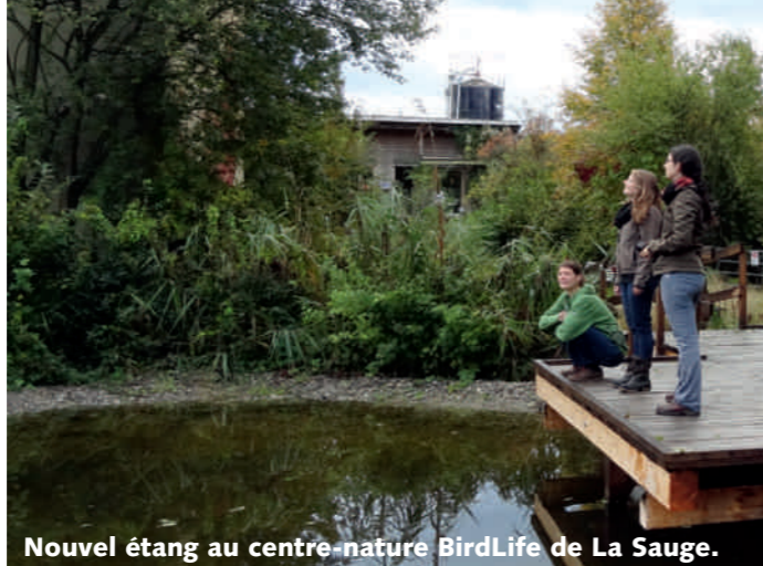
Nouvel étang au centre-nature BirdLife de La Sauge.

Ce printemps, le Centre-nature BirdLife de La Sauge a inauguré sa nouvelle exposition temporaire intitulée «La nature près de chez soi». Le visiteur peut observer sous la loupe les insectes qui se prélassent sous son canapé ainsi que certains petits animaux du jardin, confortablement installés dans des terrariums. L'exposition informe des enjeux liés au maintien et à la favorisation de la biodiversité près de chez soi. Le visiteur peut aussi découvrir le nouvel étang didactique qui permettra une meilleure approche de la faune et la flore aquatiques. Cette année aussi, le Martin-pêcheur a niché plusieurs fois avec succès sur le petit étang . Un couple de castors a nouvellement colonisé le site. Nous espérons que ces