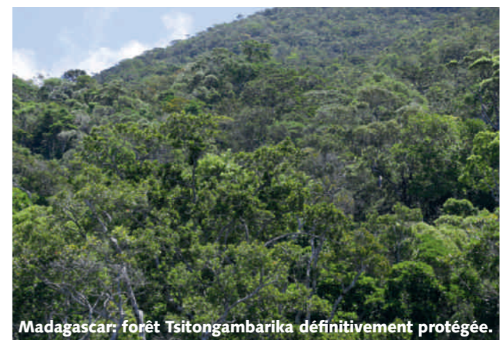
Madagascar: forêt Tsitongambarika définitivement protégée.

contributions de fondations. Le travail se poursuit, car il faut maintenant veiller à ce que la protection soit effectivement appliquée. Depuis une dizaine d'années, BirdLife Suisse contribue à la protection de la forêt tropicale de Harapan à Sumatra . Le dernier soutien a été rendu possible grâce à la Fondation «L'Art pour la forêt tropicale»: un achat de véhicules et de matériel pour la lutte contre les incendies de forêt. C'était particulièrement important en cette année de grande sécheresse. Grâce au soutien venu de Suisse, plus de 20 incendies ont rapidement pu être éteints.