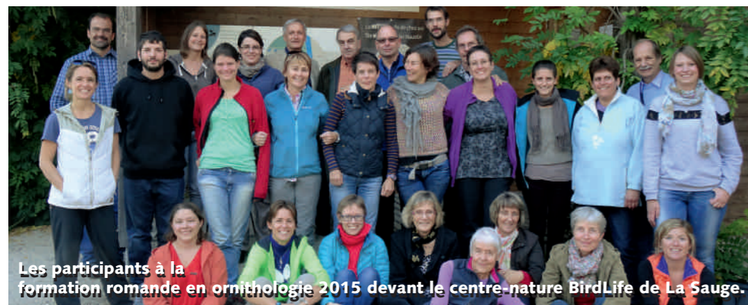
Les participants à la formation romande en ornithologie 2015 devant le centre-nature BirdLife de La Sauge.