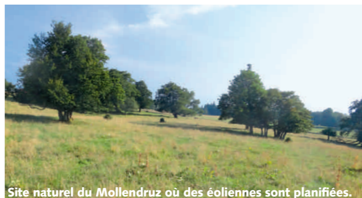
Site naturel du Mollendruz où des éoliennes sont planifiées.

hydrauliques ne doivent pas se construire au détriment des sites naturels restants. BirdLife Suisse vérifie si les projets d'éoliennes peuvent être autorisés selon les lois sur la protection de l'environnement. Si ce n'est pas le cas, nous demandons une vérification juridique.