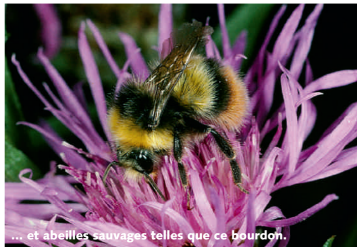
... et abeilles sauvages telles que ce bourdon.