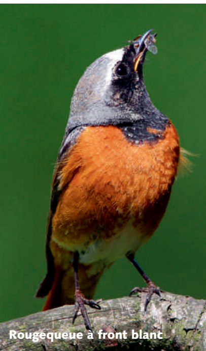
Rougéqueue à front blanc

La biodiversité en milieu agricole diminue toujours fortement. Le recul de l'Alouette des champs, du Rougequeue à front blanc et d'autres espèces se poursuit. BirdLife Suisse se bat donc avec les autres organisations de protection de la nature contre la volonté de l'Office fédéral de l'agriculture de diminuer le subventionnement de mesures en faveur de la biodiversité. L'office prétend que l'objectif est atteint avec les 65 000 ha de surfaces de promotion de la biodiversité en plaine. BirdLife Suisse a pu montrer dans une analyse détaillée que cela n'est pas le cas et que seul un tiers des objectifs en matière de biodiversité est atteint.