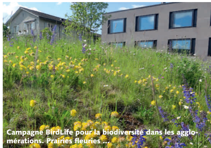
Campagne BirdLife pour la biodiversité dans les agglomérations. Prairies fleuries ...

De nombreux souhaits de la campagne de BirdLife Suisse sur les forêts ont été intégrés dans les objectifs de l'OFEV pour la biodiversité en forêt . Au Parlement, il a fallu contraindre cet automne une attaque contre la protection de la surface forestière.