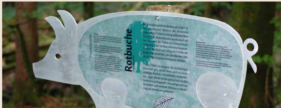
Originelle Vorstellung der Rotbuche, auch mit kulturellem und wirtschaftlichem Hintergrund

Auf dem Lehrpfad durch eine strukturreiche Landschaft mit markantem Kleinrelief können Besucherinnen und Besucher zahlreiche Kleinlebensräume mit vielfältigen Ökosystemen kennenlernen. Für das Toggenburg typische Baumarten werden vertieft vorgestellt. Viel Interessantes wird nicht nur über die Biologie der Bäume, sondern auch über Kulturelles und über deren wirtschaftliche Bedeutung vermittelt.