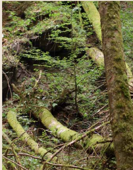
Das unwegsame Eichtobel ist reich an Totholz.