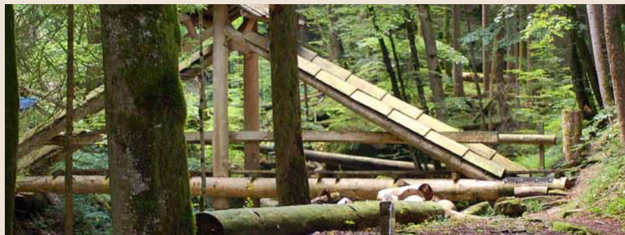
Die von Zivildienstleistenden erbaute Holzbrücke mit ansprechender Holzkonstruktion fügt sich gut in die Tobellandschaft ein.