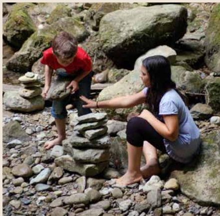
Kinder – ins «Steinmannli»-Bauen vertieft