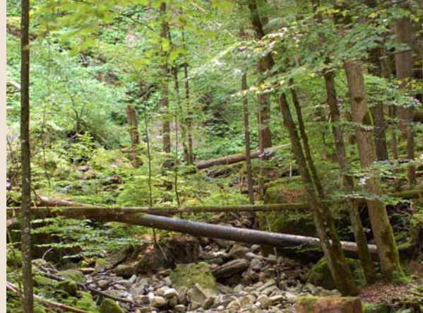
Naturnaher Wald im Eichetobel mit viel Dür- und Totholz