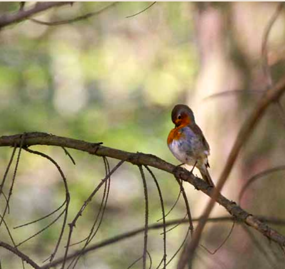
Rotkehlchen – in intensive Gefiederpflege vertieft

das sich mit mehreren Seitengräben bis zu den Gratlagen hinaufzieht, beherbergt im weiter südlichen Teil zudem seltene und bedrohte Brutvogelarten wie die Waldschnepfe.