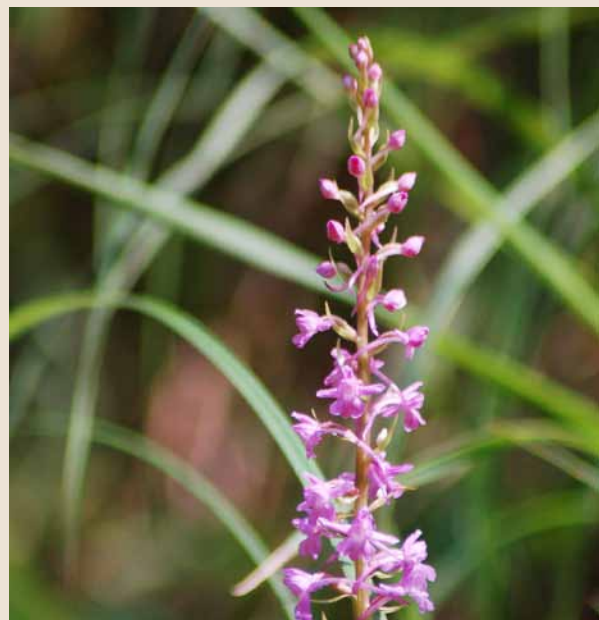
Die Wohlriechende Handwurz – eine Orchideenart – eine grazile Schönheit im urwüchsigen Tobelhang