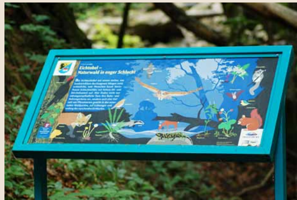
Ansprechende Lebensraumtafel zur Information über das Wildnisgebiet Eichetobel