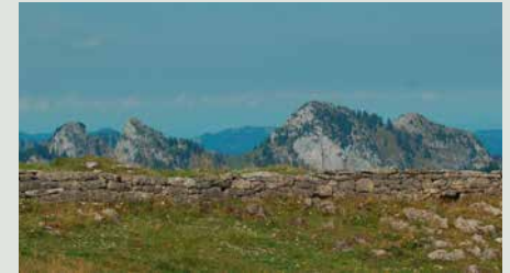
Ökologisch wertvolle Steinmauern zeugen von der traditionellen landwirtschaftlichen Nutzung der Alp.