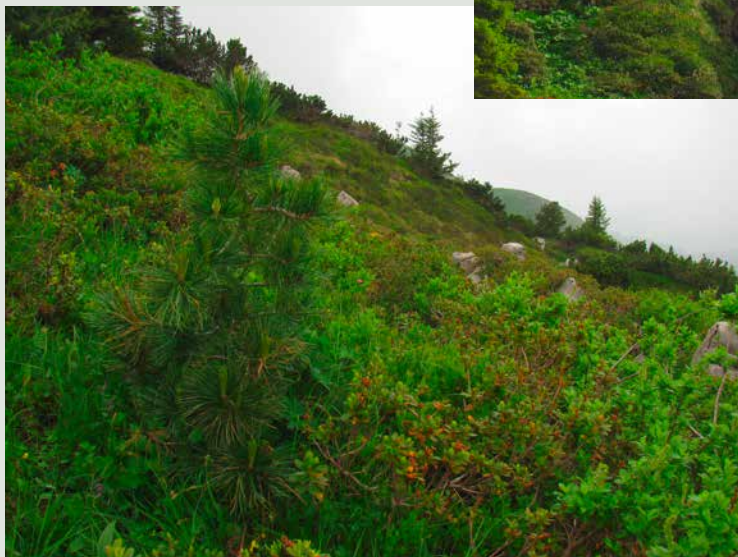
Eine in den Neunzigerjahren gepflanzte Jungarve hat sich prächtig entwickelt.