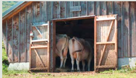
Über das ganze Alpgebiet verstreut sind die einzelnen Ställe und Alpzimmer (Alphütten).