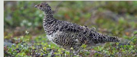
Das Alpenschneehuhn, welches vor dem Winter in ein weisses Winterkleid wechselt, ist auch im Sommer in der Vegetation der Zwergstrauchheide gut getarnt.