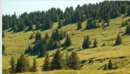
Halboffene Waldlandschaften bieten einen wertvollen Übergangsbereich zwischen Wald und Weideflächen.