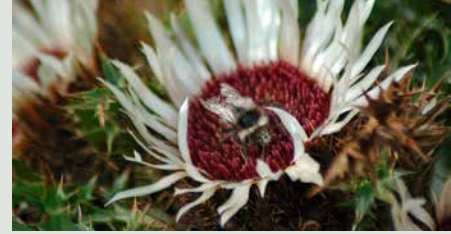
Wenn bei tiefen Temperaturen Bienen nicht mehr fliegen, sammelt die Hummel noch Nektar. Hier besuchte sie am 28. September 2013 eine Silberdistelblüte.