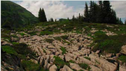
Ausgedehnte Karrenfelder mit subalpinem Mikroklima überziehen weite Teile der Alp Selun.

treut. Zusammen mit den Talbetrieben stellen die von professionellen Bauern betriebenen 16 Alpbetriebe den Lebensunterhalt von ungefähr 80 Personen dar.