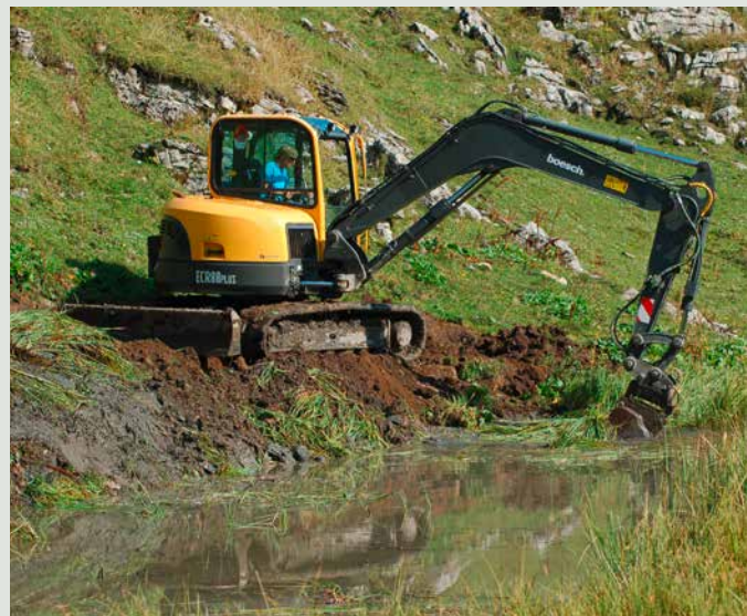
Mittels Baggereinsatz wurden die verlandeten Gewässer in diesem Herbst wieder geöffnet und vertieft.