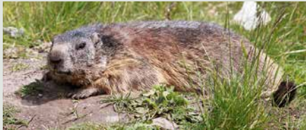
Alpenmurmeltier beim Sonnenbad. Im Alpgebiet Selun ist ein erfreulich grosser Bestand vorhanden.

Die Alp Selun, welche von grossflächigen Berggebieten umgeben ist, weist eine reiche Tierwelt auf. Eine Grosszahl von Insektenarten ernährt sich etwa vom üppigen Nektarangebot der bunten Alpenflora. Insekten und Sämereien dienen zahlreichen Kleinvogelarten aber auch den Waldhühnern als Nahrungsgrundlage. Berg- und Baumpieper, Steinschmätzer, Alpenbraunellen, Zitronenzeisige und Hänflinge weisen auf den Weidflächen gute Bestände auf. Mauerläufer und Schneefinken bewohnen zusammen mit der Bergdohle und dem Schneehuhn die oberen Felsregionen. An der Waldgrenze lebt das Birkhuhn, wäh-