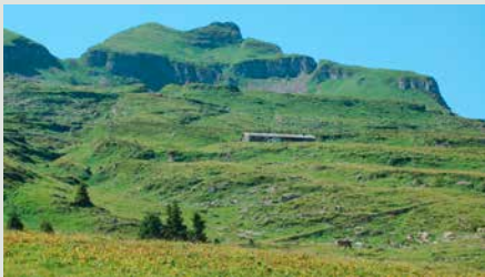
Das Alpgebiet Selun ist geprägt durch ein reich strukturiertes Kleinrelief.