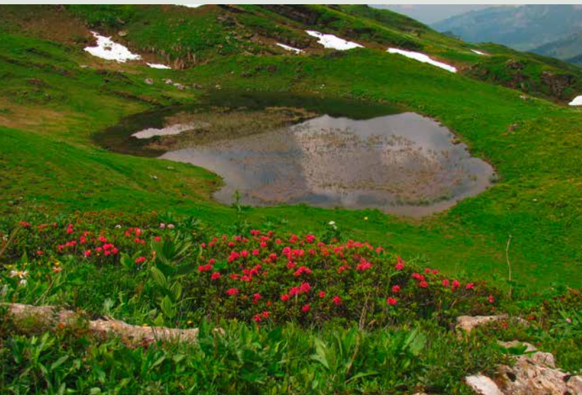
Das Gampiseelein, das grösste Kleingewässer im Alpggebiet Selun, wird regelmässig von der dort bewirtschaftenden Äpler-Familie gepflegt.