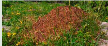
Ameisenhaufen dienen verschiedenen Tieren, darunter den Waldhühnern, als wichtige Nahrungsgrundlage zur Aufzucht ihrer Küken.

Einer Vielzahl von Säugetieren bietet diese Landschaft Lebensraum. So bewohnen zahlreiche Murmeltierfamilien das Gebiet. Eine starke Steinwildkolonie kommt neben guten Rotwild- und Gamsbeständen vor. Diese werden vom Luchs reguliert. Von den weiteren Raubtierarten sind der Baumarder und die beiden Wieselarten besonders erwähnenswert.