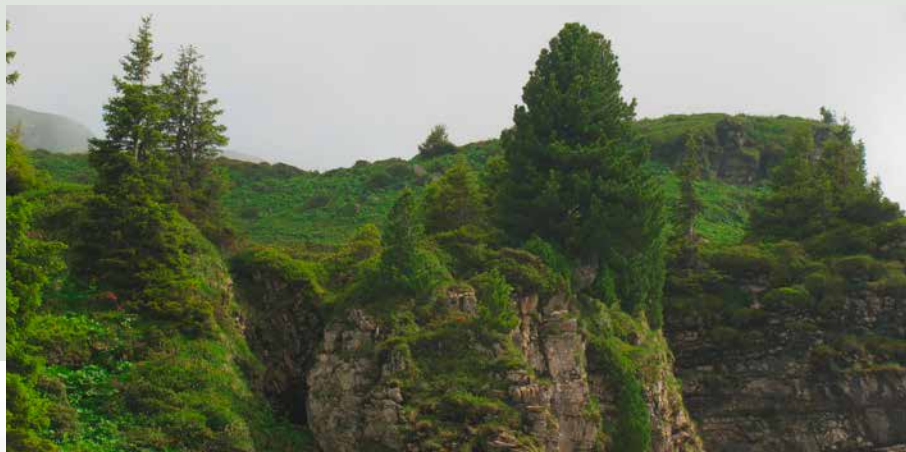
Majestätisch steht die mächtige Arve über dem Abgrund.