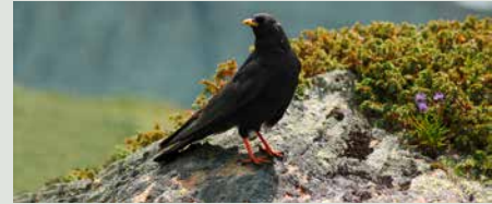
In Dolinen, auch Donnerlöcher genannt, welche durch Verwitterungsprozesse in Karstgebieten entstehen, brüten regelmässig Alpendohlen.