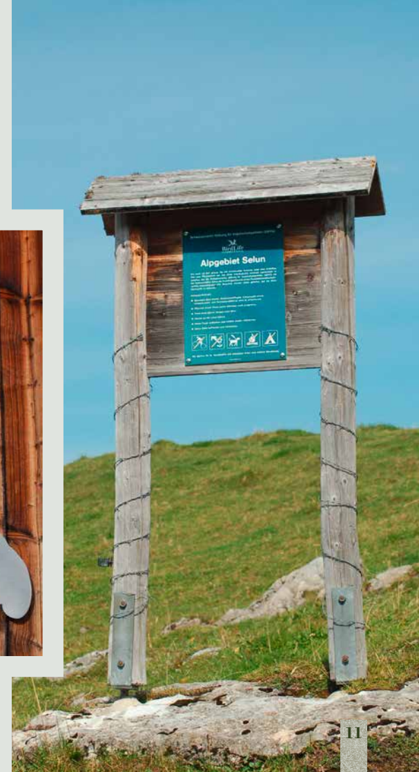
Am Eingang zur Alp Selun, beim Gatter: Informationen über die vertragliche Regelung zwischen der SSVG und der Alpkorporation Alp Selun und über Verhaltenshinweise