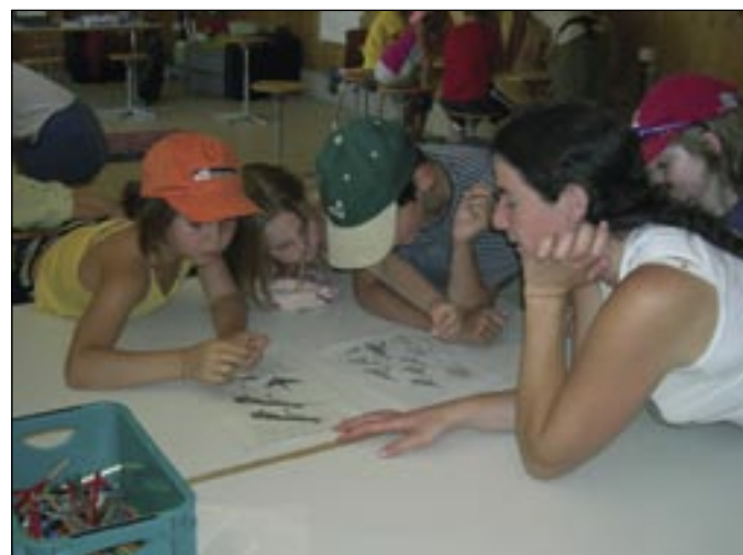
Les deux camps organisés sur place en juillet ont connu un beau succès.