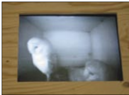
La famille de chouettes effraies a été suivie par les visiteurs grâce à une caméra infrarouge.

senté environ un quart des visiteurs. Le mois d'avril a connu la meilleure fréquentation grâce au temps très doux. Par contre, juin a été moins favorable que de coutume.