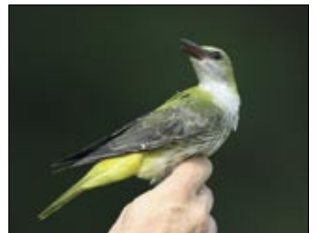
Un jeune loriot a été bagué le 8 août. Le baguage est un moyen de mesurer l'évolution de l'avifaune sur le site, en relation avec les aménagements effectués.

Grâce à une caméra infrarouge installée dans le hichoir et une transmission sans fil, un couple de chouettes effraies a pu être suivi toute la saison. Ces oiseaux ont élevé 7 jeunes avec succès puisque tous se sont envolés à la mi-juillet. Toute la nichée a été baguée devant un nombreux public le 6 juin.