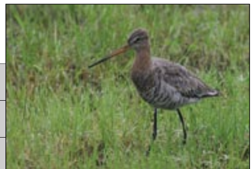
En 2007, le passage des limicoles a été sensible seulement au printemps. Ici, une barge à queue noire.