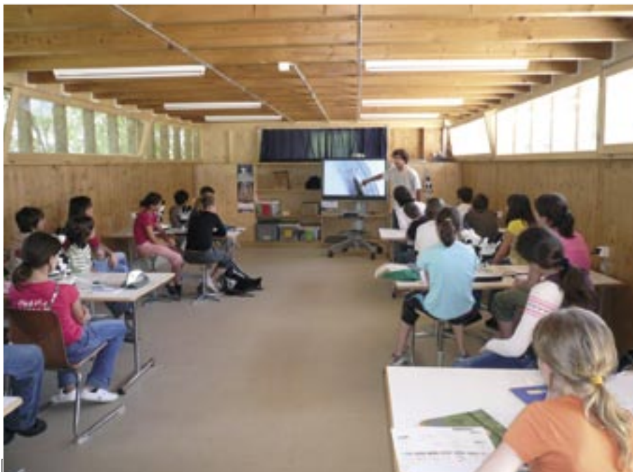
Le nouveau local aménagé par l'ASPO permet d'améliorer la qualité de l'accueil des groupes en visite à La Sauge.