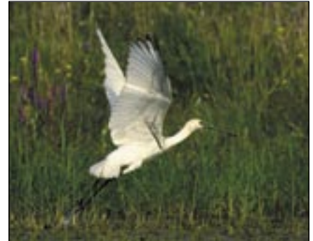
Une spatule a fait une courte mais remarquable apparition cet été.

Notre seconde salle a été transformée en vivarium présentant à la fois des ba-