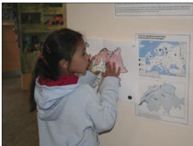
Des questionnaires permettent aux classes de profiter pleinement de la nouvelle exposition.