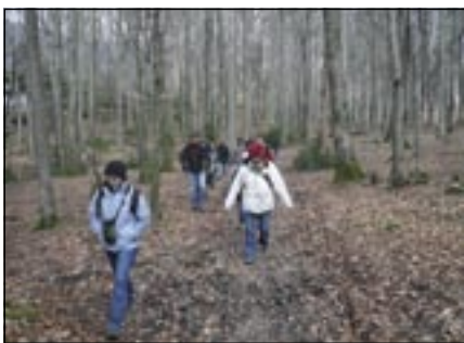
Les activités mensuelles de découverte répondent à une attente. Ici, la matinée consacrée aux pics au pied du Jura neuchâtelois.