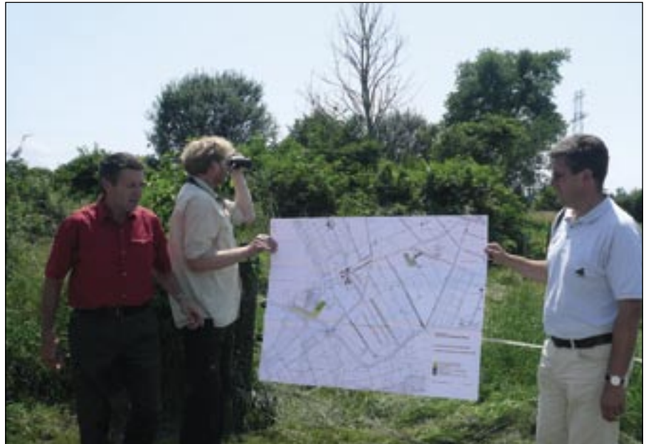
La réalisation d'un plan de gestion des réserves du Bas-Lac de Neuchâtel répond aux souhaits de l'ASPO. Ici, visite des compensations écologiques du domaine attenant de Witzwil.