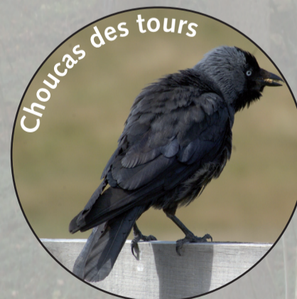
Choucas des tours

Les grimpereaux font volontiers leur nid entre l'écorce et le tronc des arbres morts. Tout comme la sittelle, ils parcourent les troncs à écorce grossière à la recherche d'insectes et d'araignées. La sittelle utilise parfois des cavités dont l'ouverture est trop grande. Elle la colmate alors à sa taille avec un mélange de terre et de salive. Le rougegorge familier et le troglodyte mignon apprécient les tas de branches pour nicher.