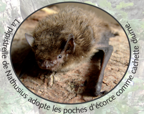
La pipistrelle ou Nathusius adopte les poches d'écorce comme cachette d'hiver.