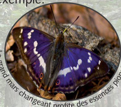
Le grand mars changeant profite des essences pionnières.

Les essences pionnières comme le saule marsault à floraison précoce sont des plantes nourricières précieuses pour des espèces rares de papillons forestiers et pour la gélinotte des bois par exemple.