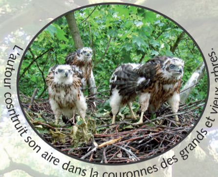
L'autour construit son aire dans la couronnes des grands et vieux arbres.

Les vieux et gros arbres développent souvent des grandes couronnes ensoleillées qui invitent à la construction d'aires ou qui ménagent dans la forêt, par ailleurs sombre, des zones bien exposées au soleil appréciées des insectes.