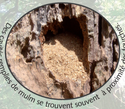
Des cavités remplies de mulm se trouvent souvent à proximité des fourches.

Les fourches sont des ramifications du tronc à proximité de la couronne. Elles créent des conditions particulières et on y trouve fréquemment des cavités remplies de mulm, qui offrent un habitat à une foule d'organismes.