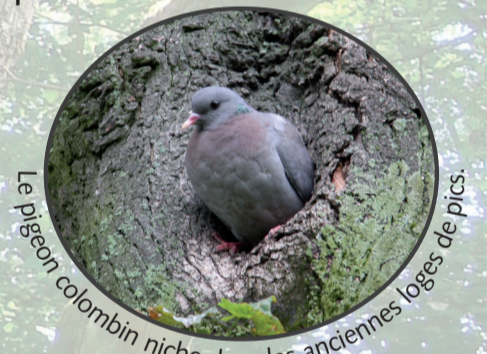
Le pigeon colombin niche dans les anciennes loges de pics.

Les cavités façonnées par le pic noir sont intensément utilisées après le départ de celui-ci: plus de 60 espèces y trouvent un lieu pour nicher, s'abriter ou cacher de la nourriture. Parmi elles figurent des espèces de coléoptères hautement spécialisées.