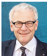
Kurt Fluri, Nationalrat FDP

«Die Bedeutung der Biodiversität als Lebensgrundlage ist nicht bestritten, dennoch nimmt die biologische Vielfalt seit Jahrzehnten ab. BirdLife sorgt dafür, dass diese Tatsache sowie die Notwendigkeit einer Trendumkehr nicht vergessen gehen. Als Geschäftsstelle der Parlamentarischen Gruppe ‚Biodiversität und Artenschutz‘ unterstützt sie die notwendigen Schritte im Parlament.»