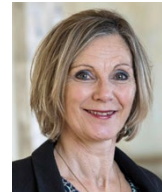
Maya Graf, Ständerätin BL, Biobäuerin

«BirdLife ist mit Sektionen in den Gemeinden lokal verankert, mit den kantonalen Vogelschutzverbänden in den Kantonen aktiv und mit BirdLife Schweiz und BirdLife International weltweit vernetzt. Das ist enorm wertvoll für einen starken Naturschutz.»