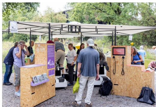
Unten: Im Naturzentrum konnte die BirdLife-Sonderausstellung mit Insekten-Flugsimulator besichtigt werden.