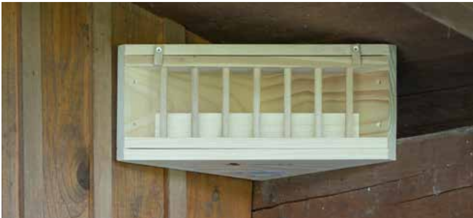
Le nichoir triangulaire protège mieux la couvée des prédateurs.