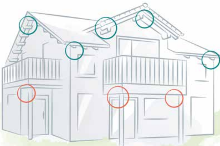
De nombreux bâtiments offrent des lieux de nidification adaptés pour installer des aides à la nidification destinés aux semi-cavernicoles. Les cercles bleus indiquent les endroits adaptés à la nidification et où des aides à la nidification pourraient être installées. Les autres endroits possibles pour installer des nichoirs sont indiqués en rouge.

Notre nichoir triangulaire est spécialement apprécié du rougequeue noir. Ses petits barreaux de bois verticaux protègent en grande partie les pontes des pies, des corneilles et des autres pilleurs de nids. Le nichoir s'imbrique particulièrement bien dans l'angle de deux parois attenantes. Il est disponible auprès de la Station ornithologique suisse.