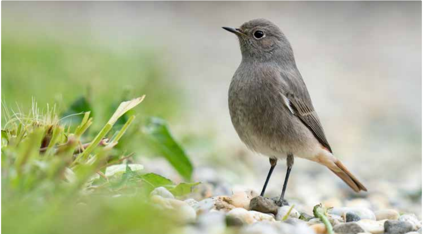
Rougequeue noir