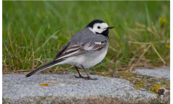
Le gobemouche gris (à gauche) et la bergeronnette grise (à droite) sont des semi-cavernicoles typiques, qui aiment construire leurs nids dans les niches de bâtiments.