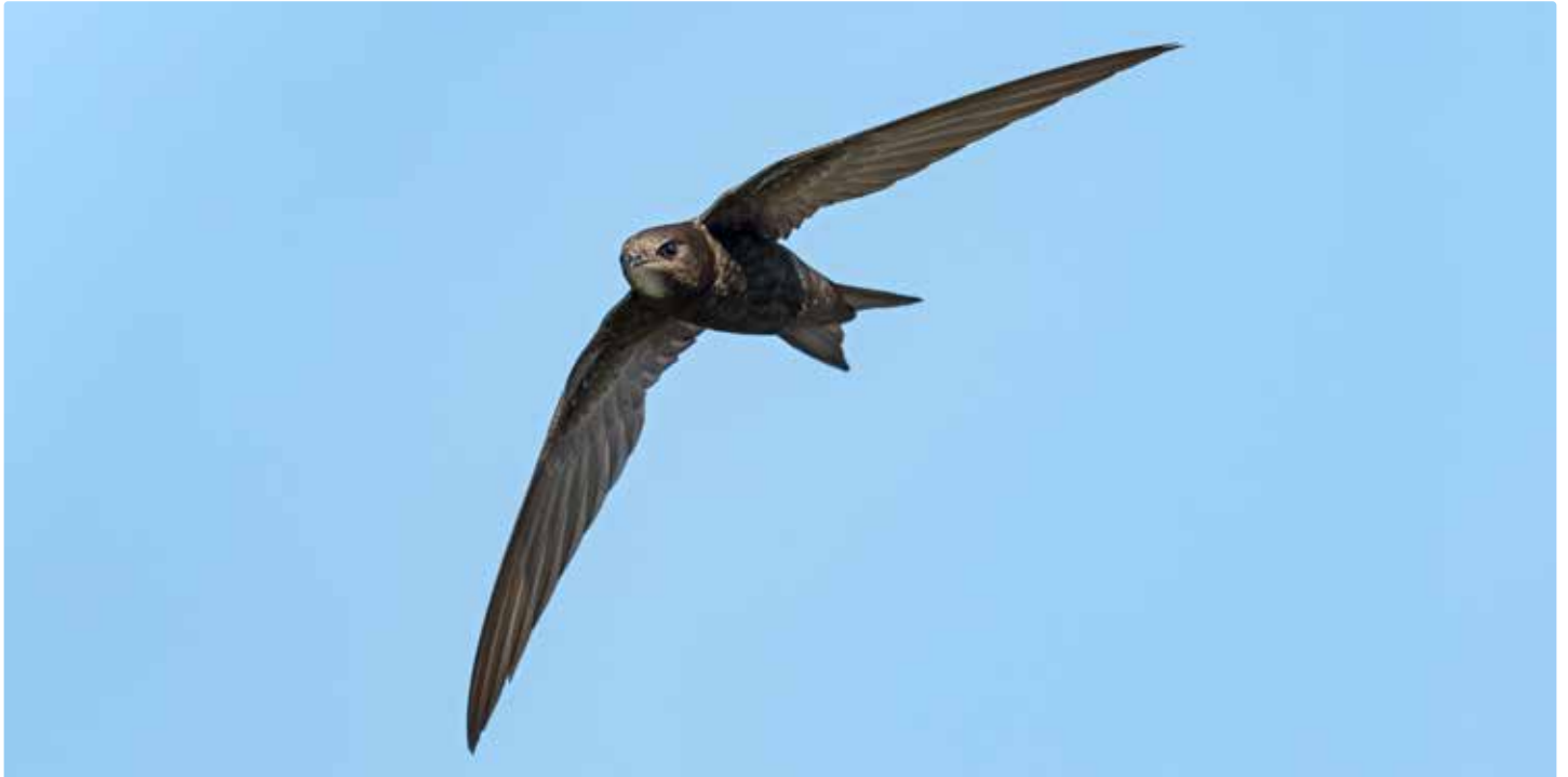
Martinet noir