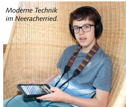
Moderne Technik im Neeracherried.

Themenkiste Biber ausgeliehen werden. Sie beinhaltet umfangreiches Anschauungsmaterial, Literatur und didaktische Unterlagen.