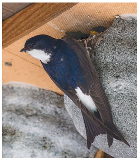
Mehlschwalben sind zunehmend auf Nisthilfen angewiesen.