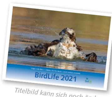
Titelbild kann sich noch ändern