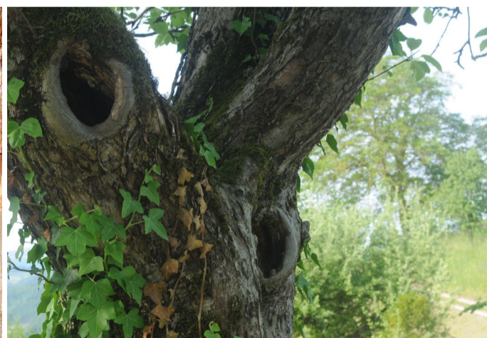
Asthöhlen sind als natürliche Nistplätze wertvoll.