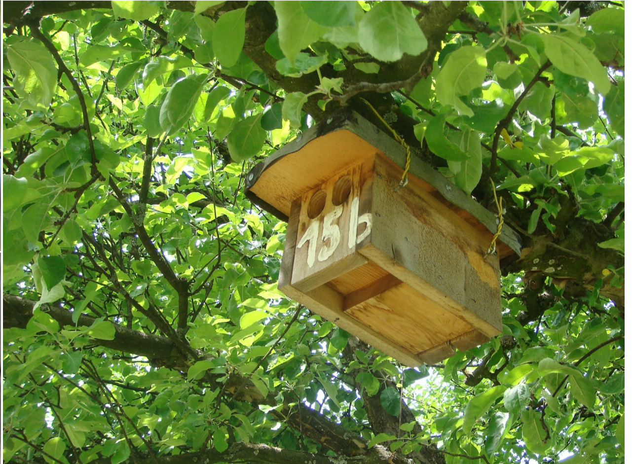
Nisthilfen unterstützen bedrohte Arten wie zum Beispiel den Gartenrotschwanz (oben) oder den Wiedehopf (unten)

Nistplätze sind ein wichtiger Faktor für die Biodiversität eines Obstgartens. Natürliche Nistplätze, wie zum Beispiel Asthöhlen, sollten deswegen unbedingt erhalten werden. Neben den natürlichen Nistplätzen können Obstgärten zusätzlich mit Nistkäsen aufgewertet werden. Dabei sollten insbesondere die Anforderungen von bedrohten Arten berücksichtigt werden.