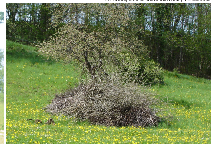
Totholz, Hecken und Asthaufen bieten ebenfalls Nistmöglichkeiten.

Mehr Informationen unter: www.birdlife.ch/merkblaetter#nisthilfen