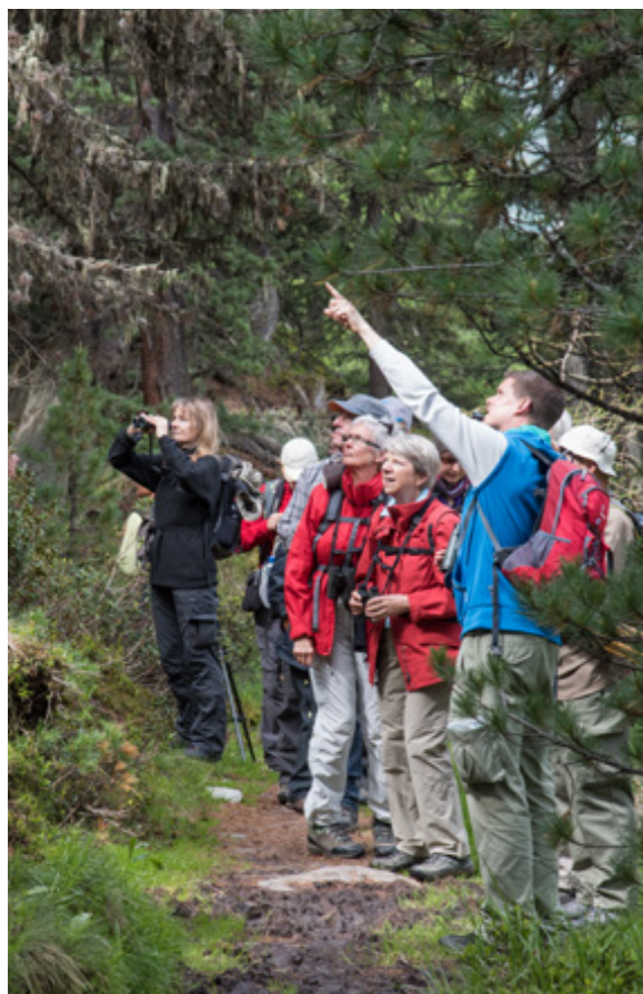
Découvrir la diversité de la nature avec un guide qualifié – des moments inoubliables !

La combinaison entre le travail bénévole et professionnel au sein de BirdLife Suisse garantit une utilisation ciblée des cotisations des membres, des dons et des legs. BirdLife est tributaire du soutien financier privé. Les dons à l'association sont exonérés d'impôts.