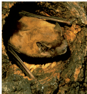
Säugetiere (Grosser Abendsegler)