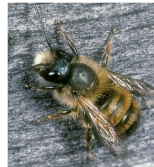
Insekten (Rote Mauerbiene)