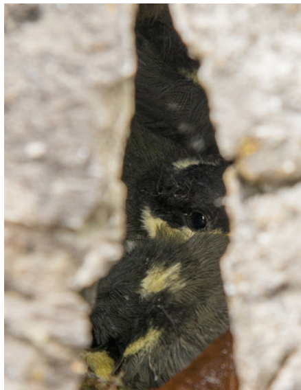
...junge Tannenmeisen im Nest...