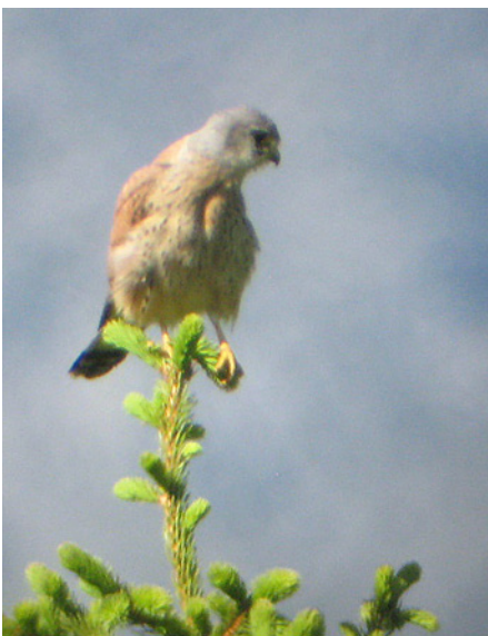
Die ersten Regengüsse kamen schon während der Samstags-Exkursion. Trotzdem konnten wir vom ersten Tag an schöne Beobachtungen machen, z.B. ...