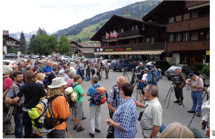
Bei der Besammlung zur ersten Exkursion blieben wir noch trocken – leider änderte sich dies aber bald!