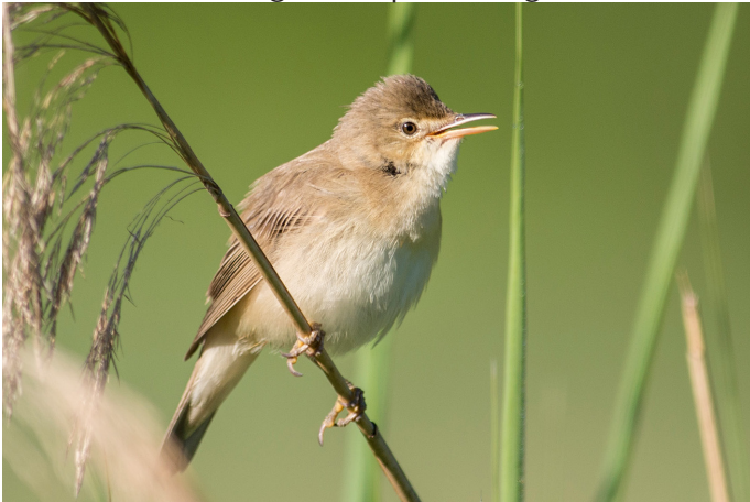
Am Lenkerseeli sangen Sumpfrohrsänger, und manche Reiherenten zeigten sich sehr zutraulich.