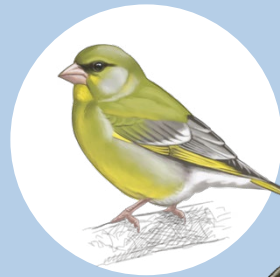
9 Verdier d'Europe