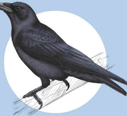
13 Corneille noire