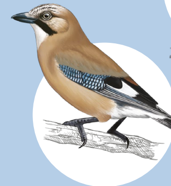
15 Geai des chênes