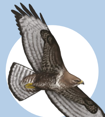
19 Buse variable