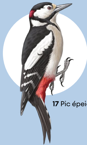
17 Pic épeiche