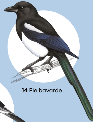
14 Pie bavarde