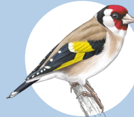
8 Chardonneret élégant