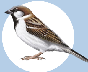
6 Moineau domestique