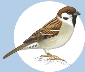
7 Moineau friquet