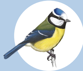
2 Mésange bleue