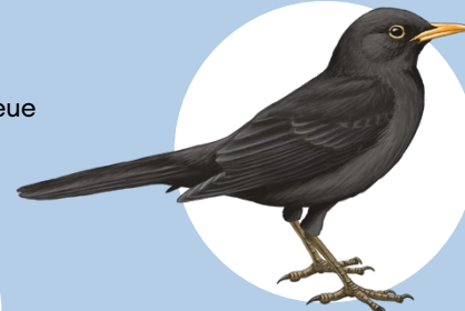
4 Merle noir