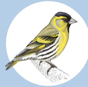
11 Tarin des aulnes