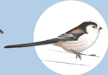
3 Mésange à longue queue