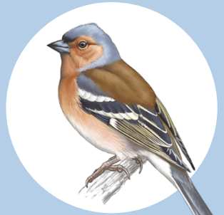
10 Pinson des arbres