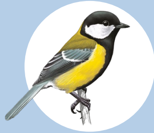
1 Mésange charbonnière