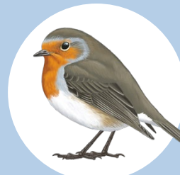
5 Rougegorge familier