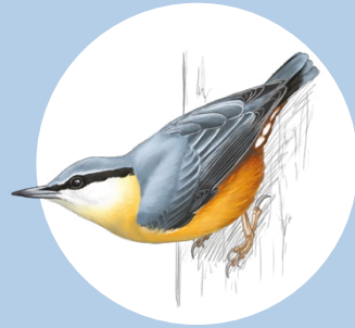
12 Sittelle torchepot